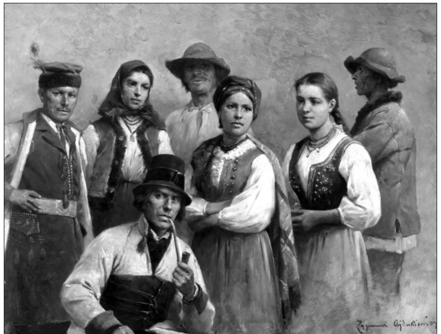
Zygmunt Ajdukiewicz: Krakkói és gorál viselet Bukovinából (1898 e.)

könyvtárból az Österreichische Nationalbibliothek örökölte az eredeti képeket és a hatalmas szerkesztőségi archívumot. Az osztrák nemzeti intézmény most először visz a nyilvánosság elé olyan, eddig sohasem közölt felvételeket is, amelyek a könyvsorozatban megjelent rajzokhoz vagy a szövegekhez szolgáltak kiindulásként.