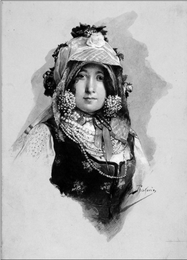
Roskovics Ignác: Sokác menyecske (1891 e.), a MNG kölcsönzése