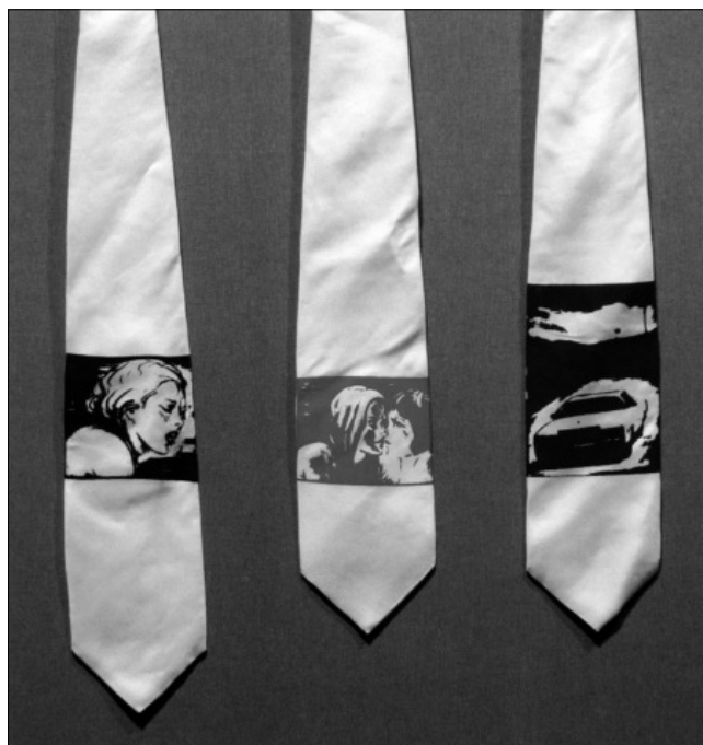
Szotyory László: Névtelen I. II. III. (nyakkendők, szitanyomat a textilen, 2007)

Színes képösszeállításunk a címlapon és a belső borítón látható.