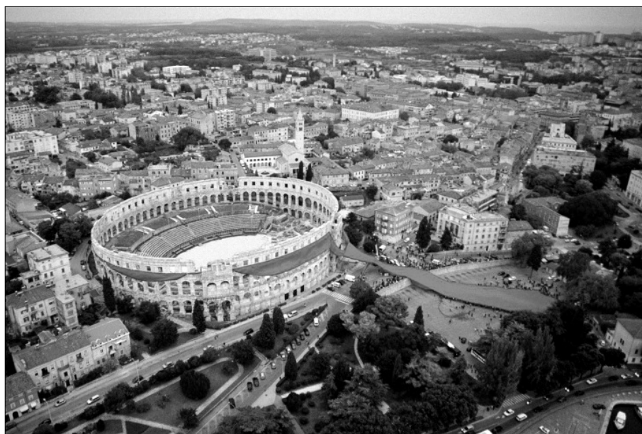
Nyakkendő Pula ókori amfiteátruma körül (2003)