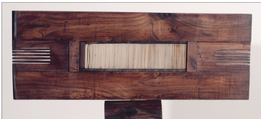
Örökségem (Szótt álom), 30 x 45 x 8, diófa