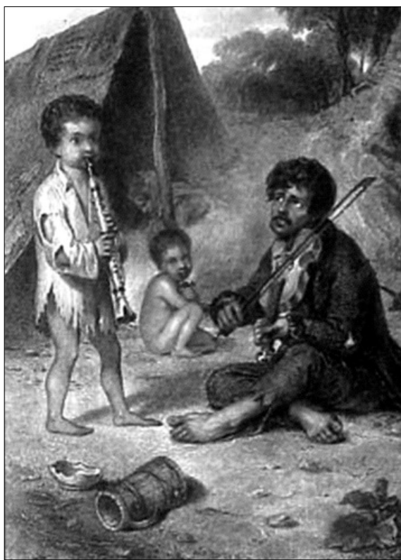
Barabás Miklós: Muzsikus cigány család