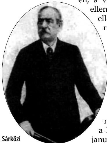
Sárközi Ferenc idősebb korában

A liptószentmiklósi Pityó József lehetett a honvédsereg legidősebb cigányprímása. A hatalmas méretű zenész 1790-ben született és 1888-ig élt. Önként csatlakozott Görgey Artúr 1849. január végén Liptó vármegyén átvonuló feldunai hadseregéhez. Részt vett az iglói, valamint a híres branyiszközi csatában. Feljegyzések szerint 1849. július 15-én, a váci főtéren gyülekező ellenséges orosz katonák ellen indított honvéd-rohamhoz – a város lángba borult alvágének láttán – az „Ég a kunyhó...” című nótával mozgósította a honvédeket.