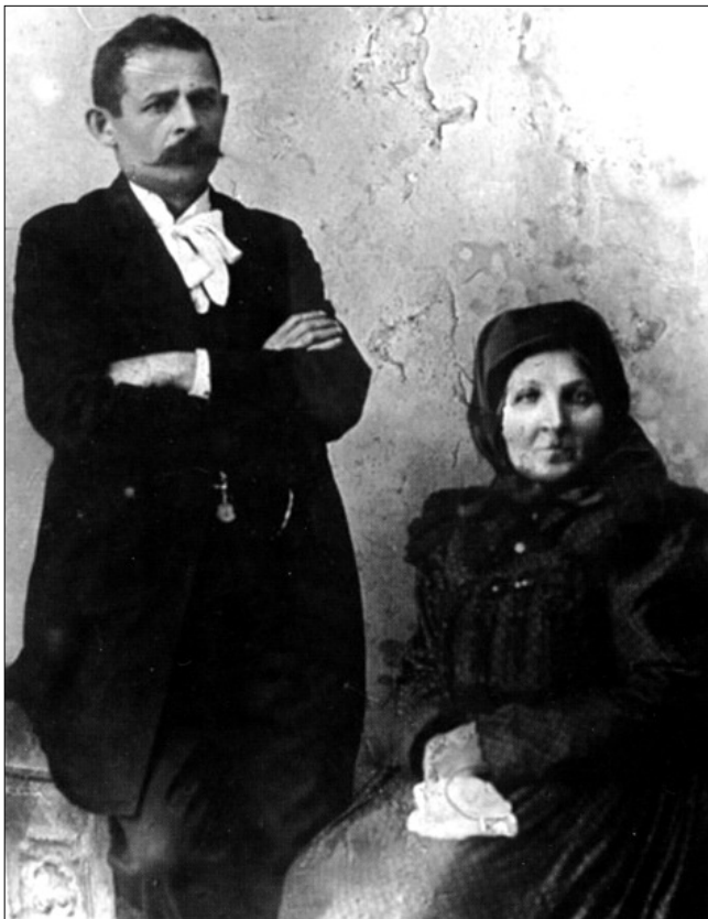
Dankó Pista édesanyjával

hoz hasonlóan, ő maga is fiatalon, tüdőbetegségben hunyt el. 1903. március 29-én, Budapesten halt meg. Búcsúztatásán ötszáz cigány húzta a híres primás legismertebb nótáit.