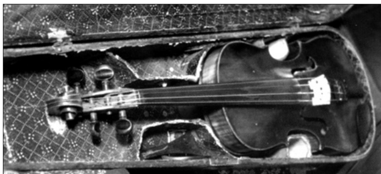
Dankó Pista hegedűje