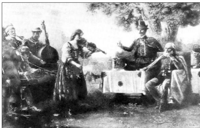
Czinka Pannát ilyennek látta az utókor

nagy számban alkalmazták a cigány zenészeket. Ez is erősítette a tudatot, hogy a cigányok a magyar szabadság mellett akár életüket is áldozzák. A szabadságharc leverését követő búskomor évtizedben az ellenszegülés egyik formája lehetett a magyaros viselkedés. A katonailag levert, ám lelkében, viselkedésében le nem győzött nemzet egyik látványos, „csakazértis” megnyilvánulásában a cigánybandák is fontos szerepet játszottak. Muzsikájukból az egykori dicsőség és annak jövőbeni reménye sugárzott. A „sírva-vigad a magyar” kifejezés tartalma talán ekkor érte el fénykorát.