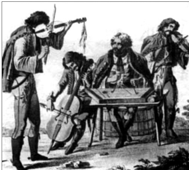
Muzsikáló cigánybanda az 1800-as évek elején