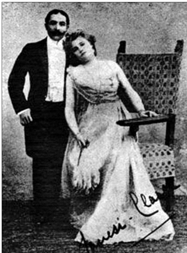
Rigó Jancsi és Clara Ward-Chimay