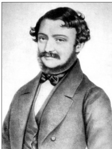
Barabás Miklós Erkel Ferencről készített kőrajza (1845)

A verbunkos zenét a katonatoborzások alkalmával szinte csak cigányok játszották, sokan ezért úgy