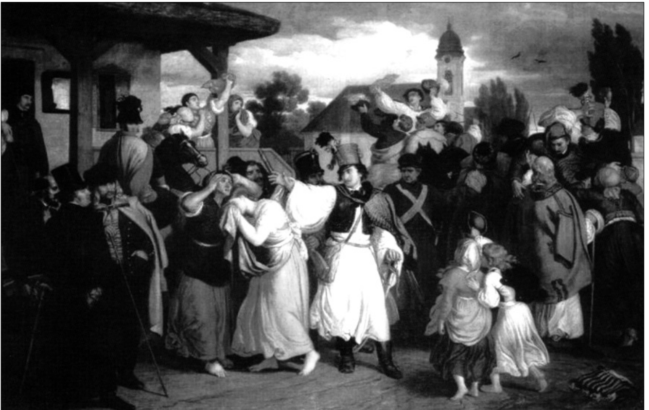
Than Mór: Újoncozás az 1848 előtti időkből

jában már nem szívesen álltak be a seregbe, ami később is jellemző maradt. A toborzóirodák vezetői rábólintottak az újításra, hogy a magyar falu ifjainak seregbe csábításához helyi zenészeket, sőt egyre inkább zenész cigánybandákat „vessenek be”. A magyar, vagy roma muzsikusok jól ismerték a „nép nyelvét”, hiszen olyan dallamokat és zenét szolgáltatottak, amilyeneket kedveltek. Ezt az állapotot és ezt az időszakot mutatja Than Mór 1861-ben készített „Újoncozás az 1848 előtti időkből” című festménye.