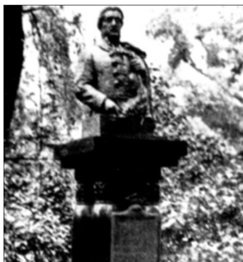
Az 1944/45-ben elpusztult margitszigeti Bihari János - szobor

Mahazánk egyik legnépszerűbb néptáncegyüttese viseli a nevét. 1928-ban a fővárosi Margitszigeten szobrot emeltek a tiszteletére, ami a II. világháborúban elpusztult. Helyén 1969-ben egy újat avattak. 1981 óta az alföldi Abonyban dombormű, 2005-től pedig Dunaszerdahelyen is szobor emlékeztet munkásságára.