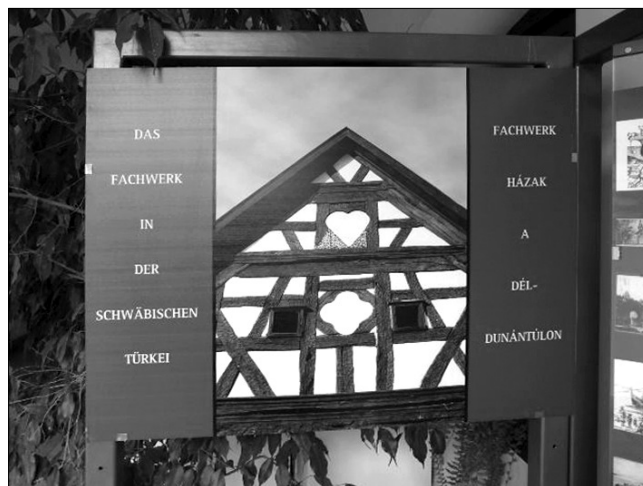
A „Fachwerk-építészet a Dél-Dunántúlon” című kiállítás 2010 februárjában volt látható a Lenau Házban. A kiállítás nemzetközi tanácskozással zárult

Április 18-án a Magyarországi Ifjú Németek Közössége kezdeményezésére a Német Szövetségi Köztársaságban élő török és hazai német fiatalokból álló csapat nagyszerű közös színházi előadást tartott a Művészetek Házában