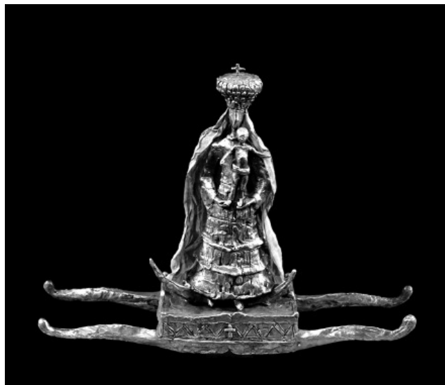
Kő Pál: Hordozható Mária (2010), bronz (terv a paksi templomhoz)