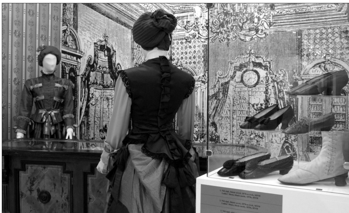
Korabeli cipőbolt rekonstrukciója a tárlaton eladóval és vásárlóval

csillagai” – Kossuth Lajosné, gróf Károlyi Györgyné, gróf Batthyány Lajosné és a Zichy grófkisasszonyok –, valamint férfi partnereik is magyar kelméből, magyar szabók által készített öltözeteket viselnek.