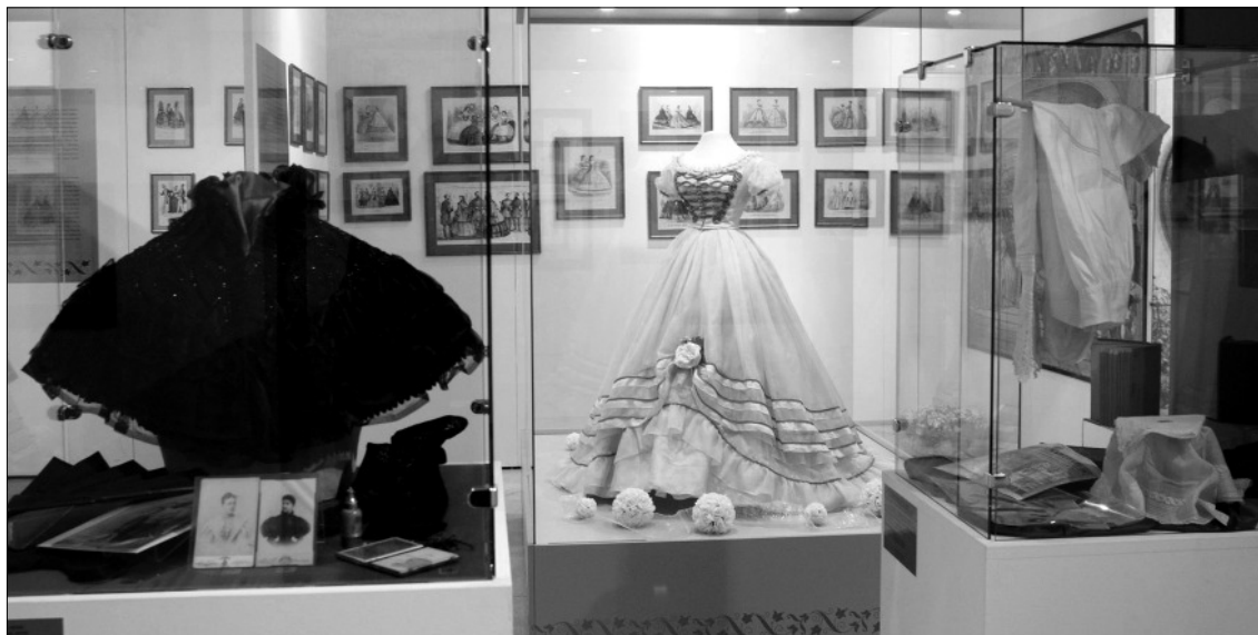
Vitrinek és korabeli fényképek a kiállításon