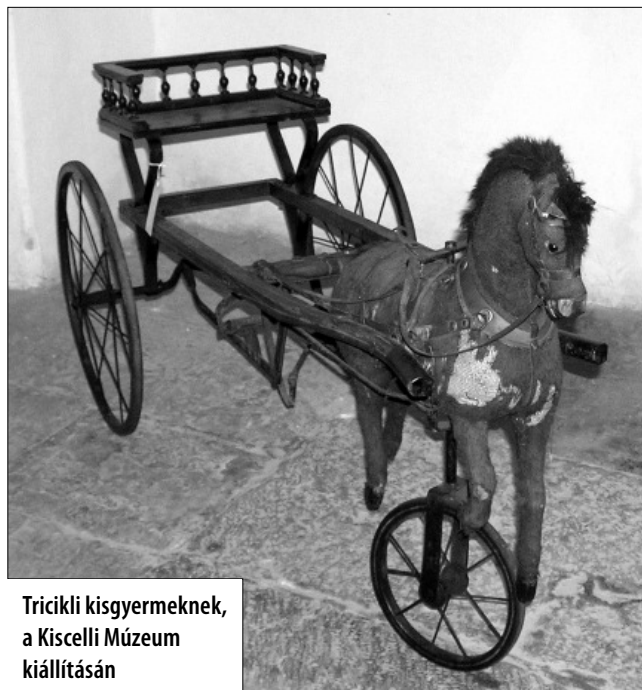
Tricikli kisgyermeknek, a Kiscelli Múzeum kiállításán