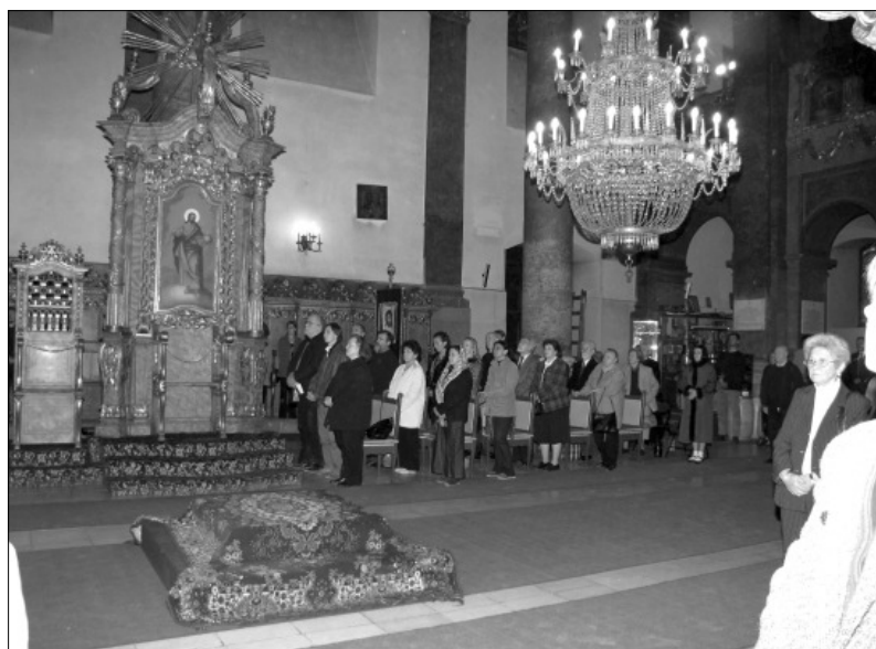
Isztentisztelet a Nagyboldogasszony-székesegyházban

A bizánci szerzetesség műveltségére és irodalmi tevékenységére vonatkozó megállapítás a IX. századi Bulgáriára is érvényes.