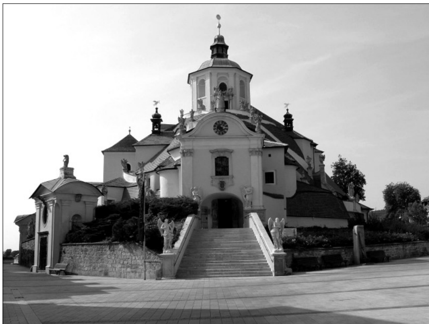
A kismartoni (Eisenstadt-i) Bergkirche búcsújáráhely, oldalában található a Haydn-templom. Itt van Haydn eltemetve.

Haydn, ahogy korábban, ma sem hagyja kisajátít-tani magát. Személye fontos kulturális összekötőka-pocs Ausztria és Magyarország közt, zenéje pedig az emberiség egyetemes világkincse. A lassan végé-hez érő – s zenei nagyságához méltó – emlékévknek mindenképp ez a legfőbb tanulsága.