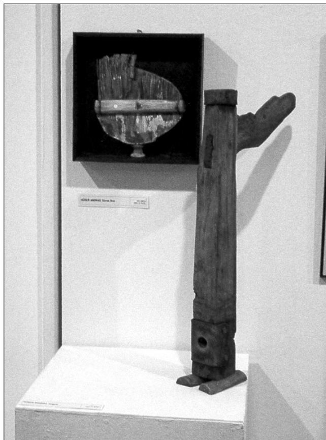
Huber András alkotása

Franciásan könnyed Forster Jakab két, vegyes technikájú látképe. Az egyik budapesti Országház ismerős körvonalait örököltette meg koratavasszal, a másik a szicíliai Mondello tengeröblét nyári verőfényben: szecessziós kaszinóval, pálmafákkal, yachtokkal.