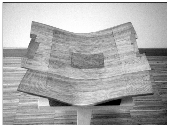
Dechandt Antal faplasztikái