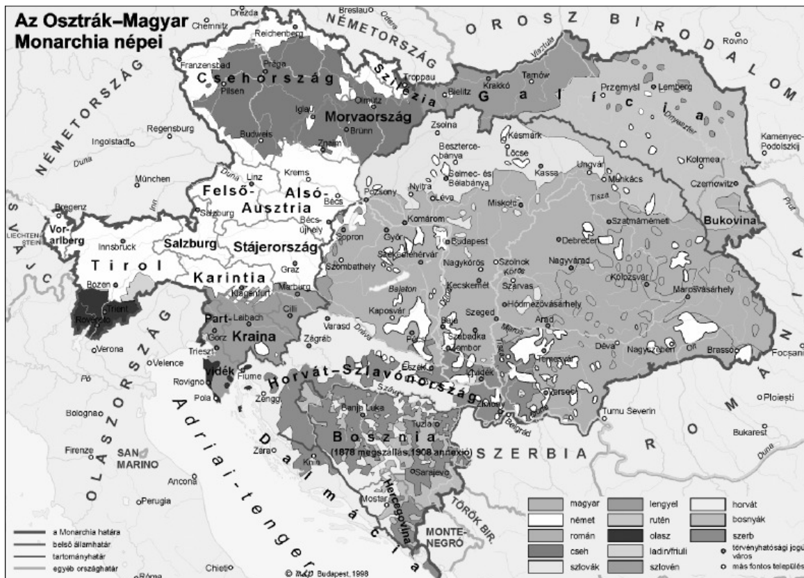
Az Osztrák-Magyar Monarchia nemzetiségi térképe. Az egykori államon ma tizenkét ország osztozik