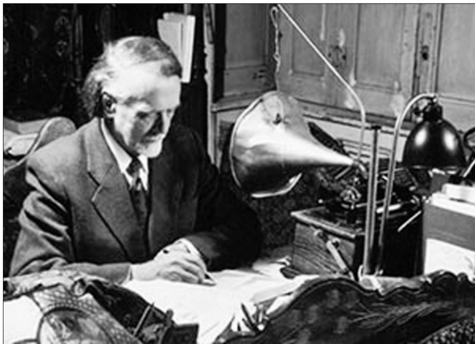
Munka közben a fonográfjal

Műveit idehaza, de külföldön is egyre többször játszották. I. vonósnyegyesét és Gordonka-zongora-szonátáját 1910-ben Zürichben, 1912-ben Párizsban, 1913-ban Londonban, 1915-ben öt amerikai városban is sikerrel mutatták be. Zeneelméleti és zenekritikai ismeretterjesztést is folytatott: a Nyugatban, az Ethnographiában , a Zenei Szemlében és a Pesti Naplóban publikált.