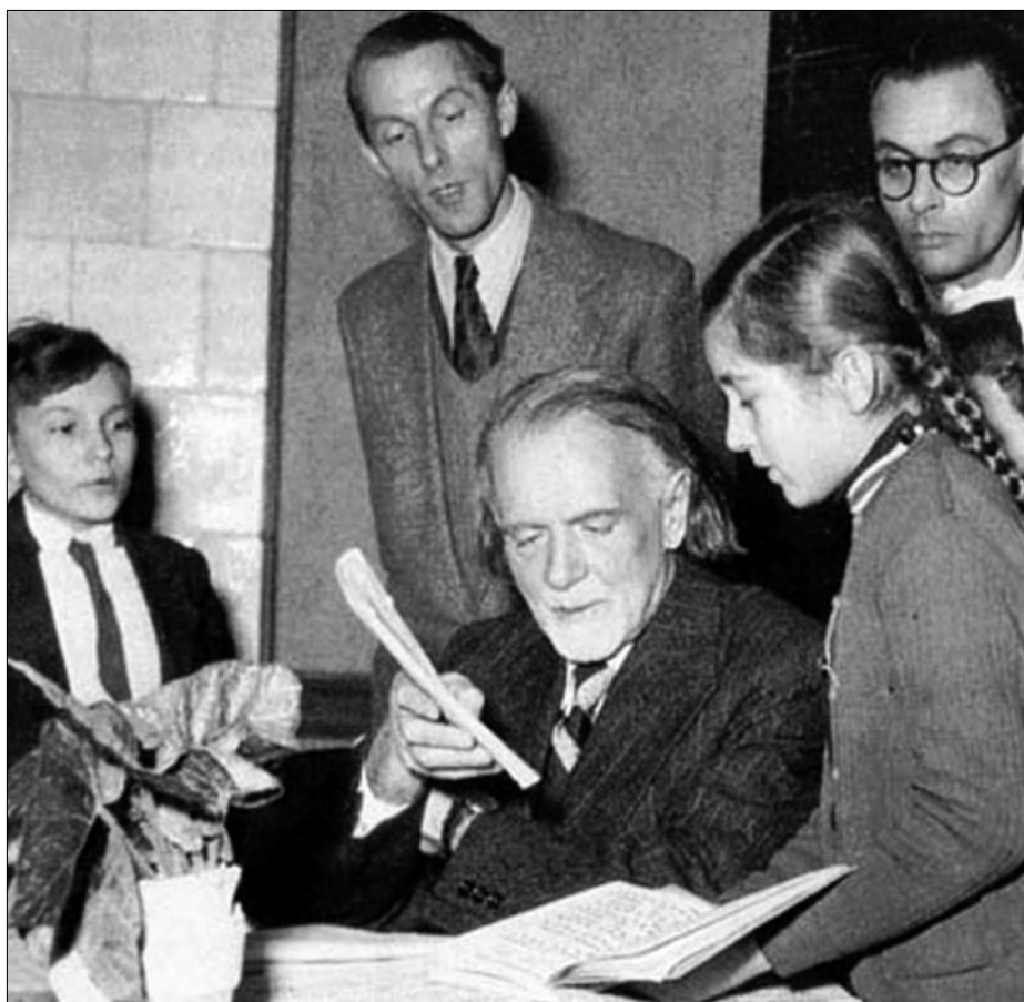
Tanítványai és barátai körében

Negyven éve, 1967. március 6-án, 85. életében, Budapesten hunyt el. Decemberben születésének 125. évfordulóját ünnepeljük