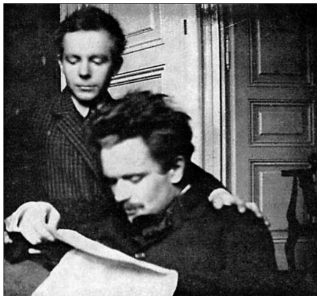
Bartók és Kodály

1904-ben megkapta zeneszerzői diplomáját, 1905-ben pedig tanárrá avatták. Egy évvel később már doktori címét is megszerezte. Témaválasztása jól jelzi, hogy bölcsészettudományi munkásságát már akkor is a zene szolgálatába állította, hiszen az irodalom és a zene határvidékét pásztázta, amikor „ A magyar népdal strófászerkezete ” címmel írta, s védte meg disszertációját. A doktori értekezéséhez szük-