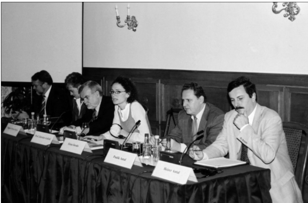
A konferencia elnöksége

jog ugyanis nem csak egyéni, hanem – jelenleg sajnos sérülő – kollektív jog is.