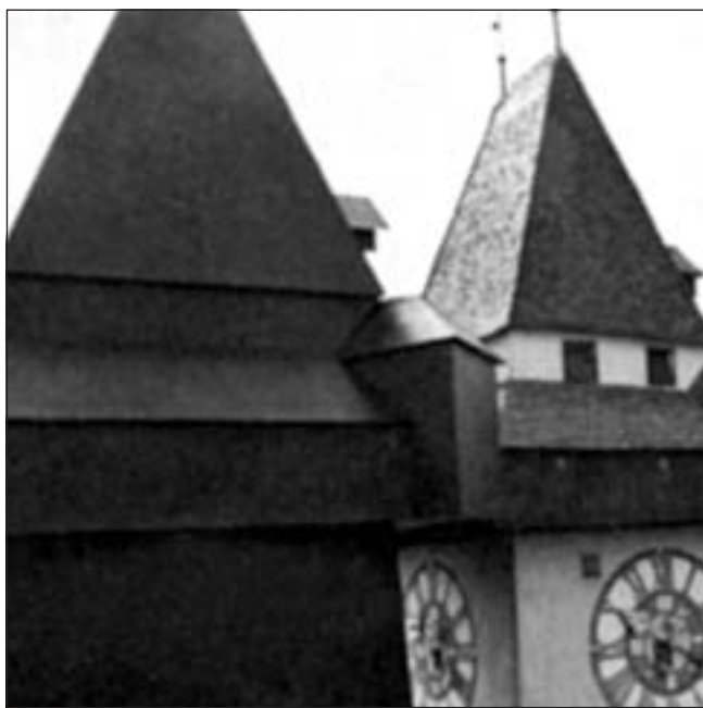
A város jelképe, az Uhrturm, a háromdimenziós árnyékkal