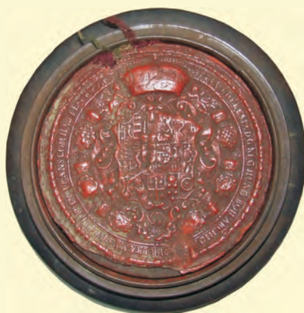
Mária Terézia királynő viaszpecsétje 1742-ből (21. sz.)

A Székelyföld múltjának megismeréséhez szolgáltatt értékes társadalom- és gazdaságtörténeti adalékokat néhány figyelemre méltó irat: egy erősen megrongálódott, 1785 januárjában keletkezett jegyzék, mely a Hóra-világ történetéhez nyújt érdekes gyergyói adatokat (kiderül belőle, hogy Ditró, Szárhegy, Alfalu, Várhegy, Maroslaka és Bélbor lakosai közül kiktől koboztak el fegyvereket a parasztfelkelés nyomán – 94. sz.); néhány 1842–1845 közötti irat a csíkszentkirályi Steckbauer-féle papírmalom múltját elevenítik meg (27–33. sz.); a tusnádi fürdőélet kezdeteire vonatkoznak a beszédmezői első fürdő-társulat 1845–1847 közötti jegyzőkönyvei (34. sz.). 30 A Székelyföld népesség- és társadalomtörténetének egyik meghatározó jelentőségű forrása, az 1614. évi lustra jóval későbbi, egyszerű másolatban olvasható (177. sz.), de egy kevésbé ismert kútfő, az 1719. évi 18 sustákos adót megfizető csíkmindszentiek jegyzéke is megtalálható a gyűjteményben (112. sz.).