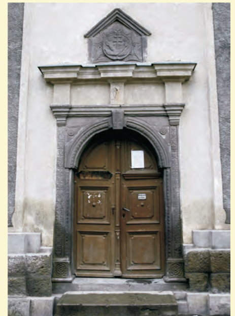
A késő reneszánsz főbejárat (1728).

A mai főhomlokzat zárt megjelenésű, egyszerűen tagozott, a Tamási