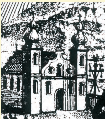
Részlet a székelyudvarhelyi Mária Társulat 18. századi emléklapjáról. Ld. A csíksomlyói ferences nyomda és könyvkötő műhely. A csíksomlyói ferences nyomdászok és könyvkötők emlékére. Szerk. Muckenhaupt Erzsébet. Csíkszereda, 2007. 49.

kivehetők az épület részletei is: a két vastag, négyszöghasáb alakú torony között van a főbejárat félköríves nyílása, a hajó teste jól elkülönül a tőle alacsonyabb és keskenyebb szentélytől, az oldalkápolnák nyílásai is csakhamar szemünkbe tűnnek. Az