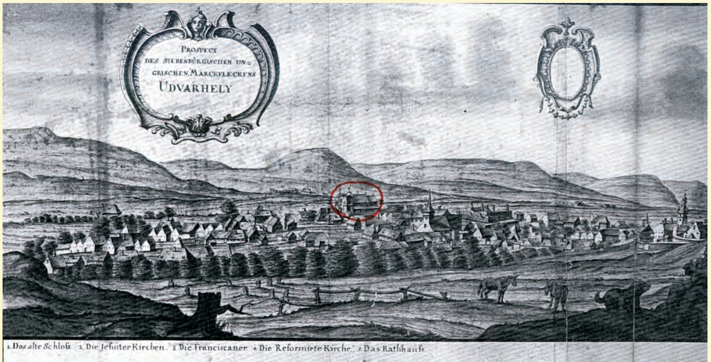
Székelyudvarhely látképe Johann Ignaz Haas metszetén. Ld. Borbély Andor: Erdélyi városok képeskönyve 1736-ból. In: Erdélyi Múzeum, 1943. 2. sz. 17. kép.

kivehetők az épület részletei is: a két vastag, négyszöghasáb alakú torony között van a főbejárat félköríves nyílása, a hajó teste jól elkülönül a tőle alacsonyabb és keskenyebb szentélytől, az oldalkápolnák nyílásai is csakhamar szemünkbe tűnnek. Az