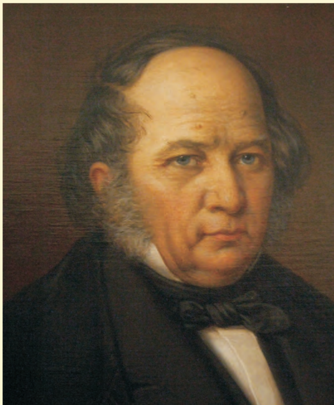
Magyarósi Szőke József Barabás Miklós festménye a Haáz Rezső Múzeum Képtárában

„Méltóságos grófné! Élve maradni lehet, csak utódink tiszteletében, Áldozatot, ha teszünk közjóra, vagyonnal, erénnyel. És kinek áll ma hatalmában, mint néked, ez inkább? Sírboltunk csontot temetendő, és húst csak, erényt nem. Hát rövid életet éljünk túl emlékezetünkkel, Erre erényes dúsnak hány utat nyit az élet? Itt a tanítók számát kellene többre emelni, Itt sajtót alapítani, Székelyhon kebelében; Özvegyek, árvák ott, korház itt, kised óvoda, Ott az örömszaporító, itt a bűnkevesítő. Száz kívánati a kórnak, jótetre hevítők! Nem szó, név, nem üres cím, tett, ember becse címje Nem kastély, hol arany tallérhegy zöldre penészlül. Boldogság, csak öröm, s legszebb öröm, amit az érez, Akinek a jótékony erény kebelét melegíti! Jótévő máshoz, legjótévőbbje magának. És mi magasabb, isteni jószághoz közelítőbb, Mint örömet s áldást árasztani emberiségre? Majd a magánrendszerben, szűk mérnök leszen a sors, Álomsírtermet mér ő mindennek egyenlőt. El nem porlandó szobor az, melyet csak az ember Önmaga míveiben, szépjával, erénnyel emelhet. Fényes emeltyű, gazdaság, érdemre, erényre! Gazdagságot amily nézőpontból mi tekintünk, Minket is oly szempontból néz, s ítél a világ is. Hogyha magunknak, boldogságnak s honnak is éltünk, Néked, idő! percet, de dicsősségnek sokat éltünk. Mert az utókor, kik voltunk, tettünkől ítéli. Milyen volt alakunk? Születésünk? Hol? Mikor éltünk? Akkor kérdezi csak, ha figyelmét nyertük erénnyel.”