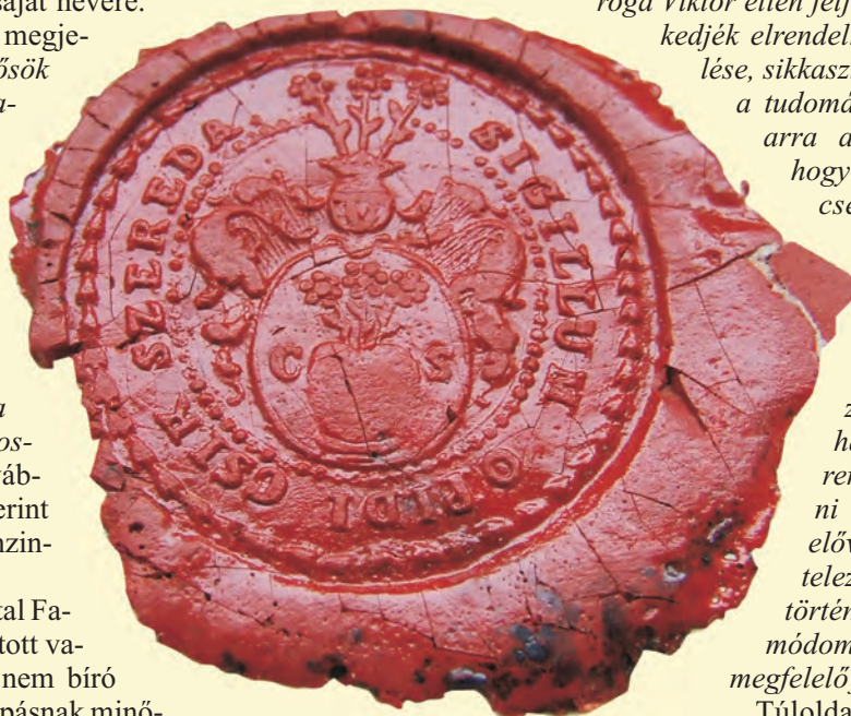
Csíkszereda város címeres pecsétjének vörös viaszlenyomata 1840-ből 24

Más kézzel: „ Irattáron nem találtam a kért iratokat. 1941. október 25. ”