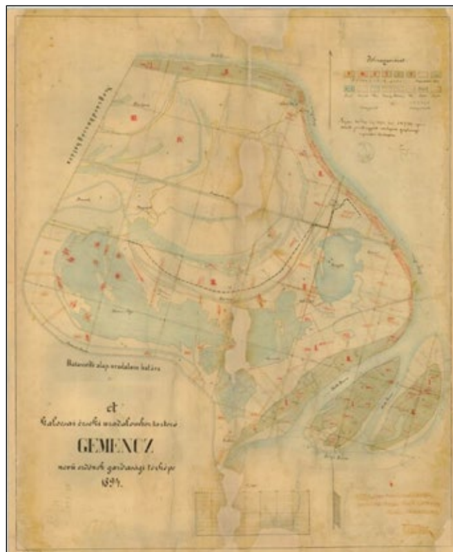
2. ábra. Gemenc térképe 1896-ból (KFL VIII. 2d No 562) s. sz. 680.

A „sucrescentia” (növekvő állomány) rossz lábón állt, ezért a letarolt részeken a pudvás fákat és tuskókat ki kellett szedni. A lábón álló ezer magyar hold (431,6 ha) erdő vágás-érett, „elvénuült” fákból állott.