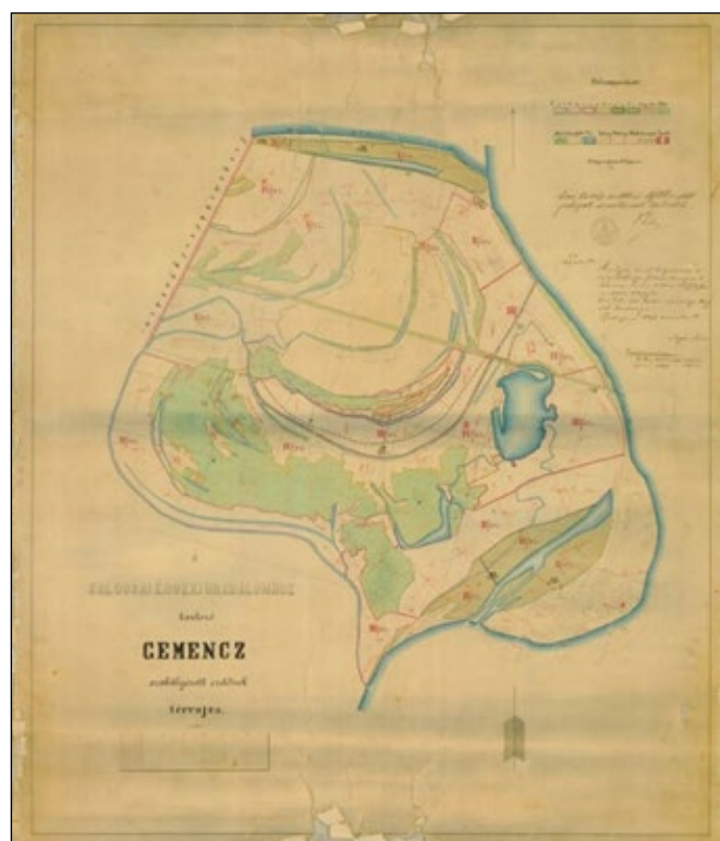
1. ábra. Gemenc térképe 1885-ből (KFL VIII. 2d No 561) s. sz. 679.

A gemenci erdőkerület rövid leírása 1836-ban: mintegy kétezer magyar hold terület (863,2 ha), nagyobb része kivágva, rétekkal és kaszálókkal vegyes erdő. A réteket és kaszálókat bérbe adta az uradalom.