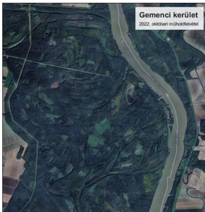
3. ábra. Jelen állapot madártávlatból

Az első leírás szerint 1836-ban tölgy, kőris, nyár és fűz fafajok által elfoglalt ezer hold nagyságú terület volt a Feketeerdő kerület Sükösd községhatárában, mely erdők között helyezkedett el a sükösdiek legelője, ami miatt a „térfoglalásra”, azaz a vágásterületek kijelölésére nagyon kellett figyelni.