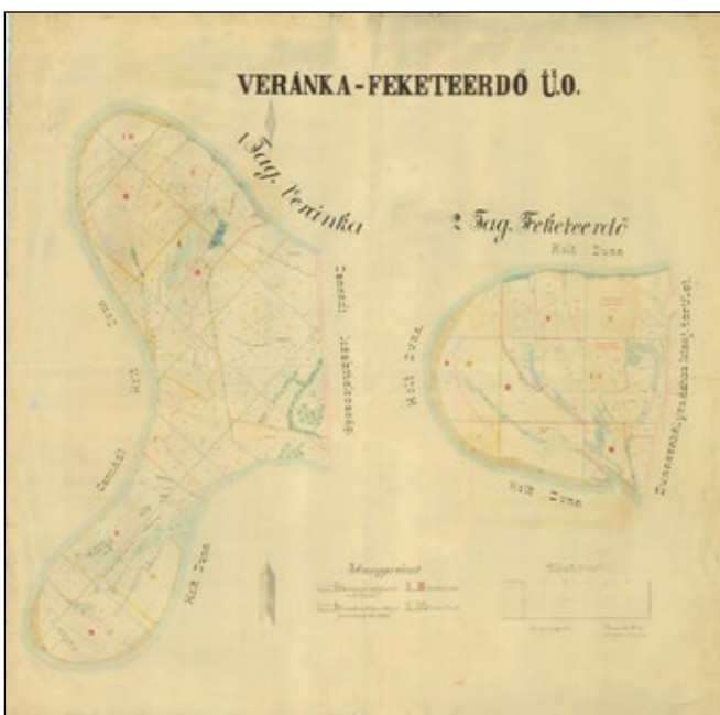
5. ábra. Veránka és Feketeerdő térképe 1917., papírtakarékossági okokból egymás mellett ábrázolva

Az 1917-es erdőterv készítője Veránkával együtt mutatja be a teljes Feketeerdőt. Szerinte a Duna szabályozása előtt a gyors folyású áradások a homokot is magukkal sodorták és lerakták, az áradások gyors visszahúzódása pedig az iszaplerakódást hiúsította meg, ezért gyenge termőhelyi adottságúak voltak ezek a területek.