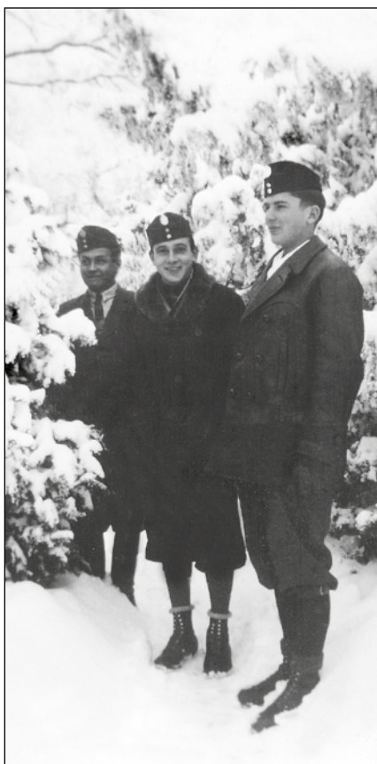
Erdőr tanulók az 1940-es években (archív)