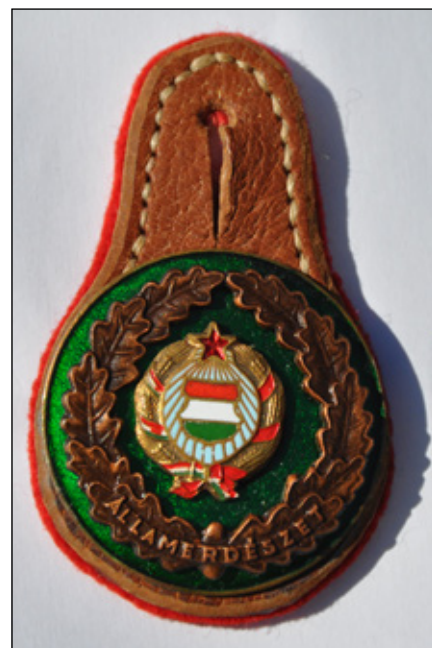
Erdészjelvény a Kádár-korszakból

Az Erdészeti gyűjtemények sorozat befejező részéhez érkeztem. Még több mindenről lehetne írni, de a legfonto-