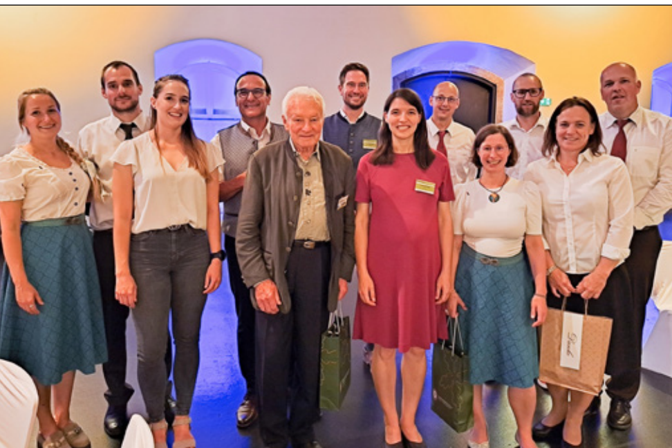
Az OEE képviselői és az osztrák vendéglátók csoportja az ünnepi banketten

A plenáris előadásokat követően került sor egy-egy témaindító kiselőadás