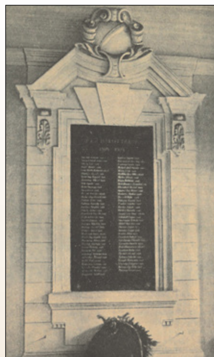
1. ábra. Az 1927-ben felavatott emléktábla a hősi halottak névsorával 8 (A fotó Krug Lajos „Tűzek a végeken” c. könyvében jelent meg 1930-ban) 9

selmeci főiskola hallgatói számára nem zárult le az első világháborús infernója 1918-ban. A nyugat-magyarországi felkelés során Ágfalva alatt 1921. szeptember 8-án elesett hallgatóink neveivel vált teljessé intézményünk első világháborús hőseinek névsora, hiszen az új otthonra találó főiskola diákjainak életáldozat árán kellett újfent tanúbizonyságot tenni hazájuk, s az őket befogadó város, Sopron iránti elkötelezettségéről, hálájáról.