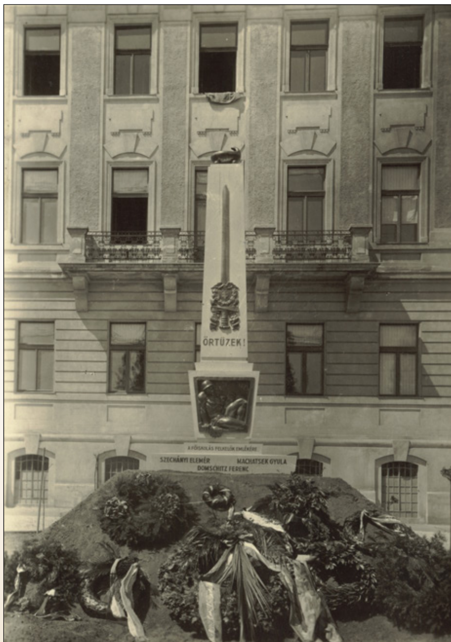
4. ábra. Az 1932. május 5-én felavatott „Örtüzek!” az emlékezés virágaival (SOE KKL)

tását. Ezzel az óhajtással teszem le rá a tanári kar koszorúját” (4. ábra).