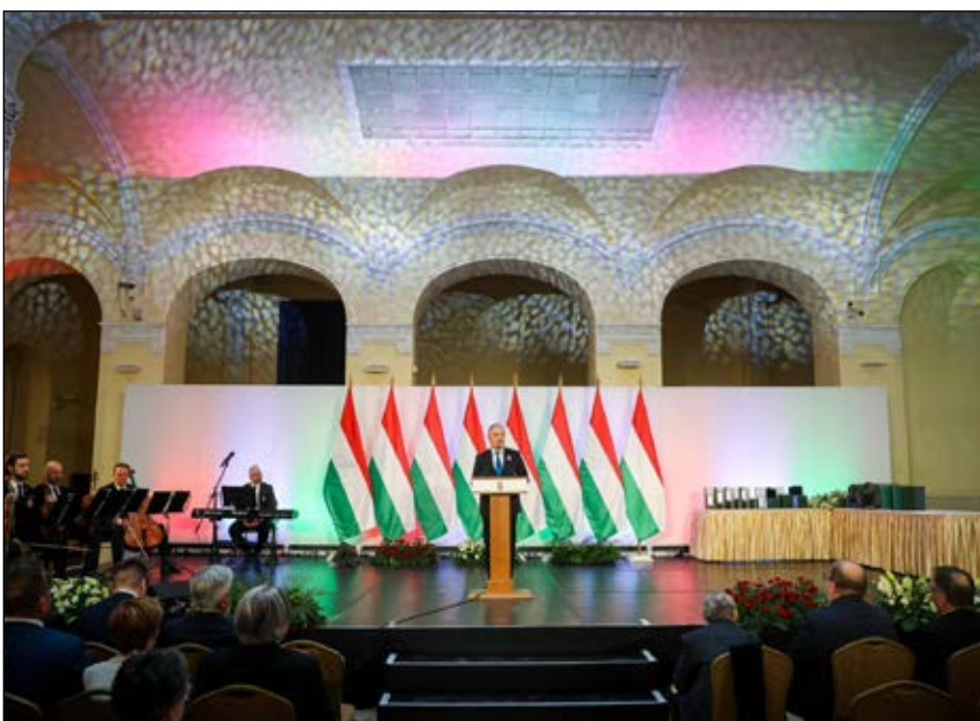
Nagy István agrárminiszter tartott ünnepi beszédet a kitüntetések átadása előtt

szereplők közötti összefogás. Az egység jelenik meg a kitüntetettek körében: bárholnan érkezenek, bármilyen szakterületen dolgozzanak, munkásságuk egy irányba mutat, ami az Agrárminisztériumhoz tartozó ágazatok, szakterületek erősítése, felemelése. Nehéz időkben különösképpen szükség van olyanokra, akik a próbatételek közepette is példát mutatnak azzal, hogy igyekeznek a legjobbat kihozni magukból és a rájuk bízott javakból, emlékeztetett Nagy István.