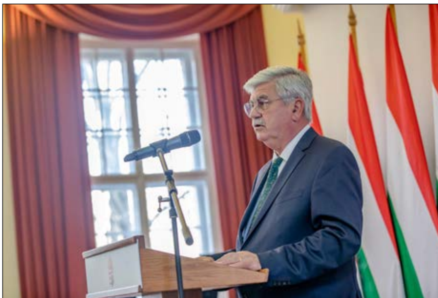
Farkas Sándor miniszter-helyettes

Az Agrárminisztérium miniszterhelyettese Budapesten, a Vajdahunyadvárban rendezett eseményen úgy fogalmazott: az erdőt ismerő és szerető ember jól tudja, mennyire szervesen és harmonikusan kapcsolódnak egymáshoz a teremtett világ élőlényei. Az erdők, a fák tevékenyen részt vesznek az UV-sugárzás szűrésében, a szálló por, a szén-