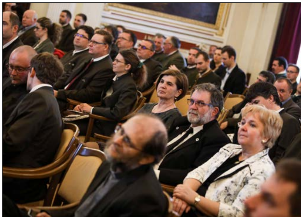
A konferencián elhangzott előadások fókuszában az ideai erdők világnapi FAO jelmondat, az „Egészséges erdők az egészséges emberekért” állt.