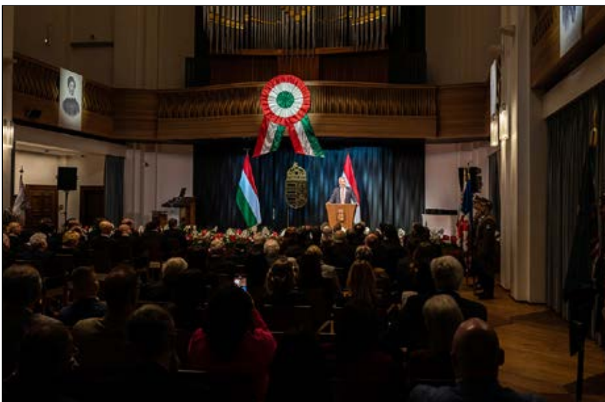
Semjén Zsolt miniszterelnök-helyettes a Karmelitákban tartott díjátadáson

A tárcavezető köszöntötte az agrárium területén kiemelkedő teljesítményt nyújtókat, és hangsúlyozta, hogy a siker kovásza az agráriumban az ágazati