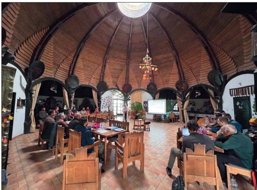
Akkreditált szakmai előadásokkal kezdődött a szakosztály ülése Visegrádon

Szeptember 20–21-én a Pilisi Parkerdő Zrt. Visegrádi Erdészetének területén került megrendezésre az Erdőfeltárási Szakosztály őszi terepi programja. A kétnapos program során előadásokra, terepi programra, tisztújításra és baráti beszélgetésekre is jutott idő.