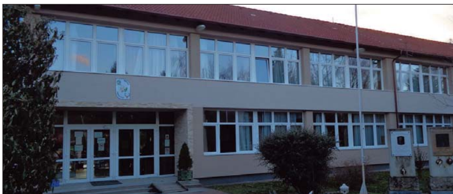
Az Északi ASzC Mátra Erdészeti Technikum, Szakképző Iskola és Kollégium épületében tartotta a helyi csoport a tisztújítást