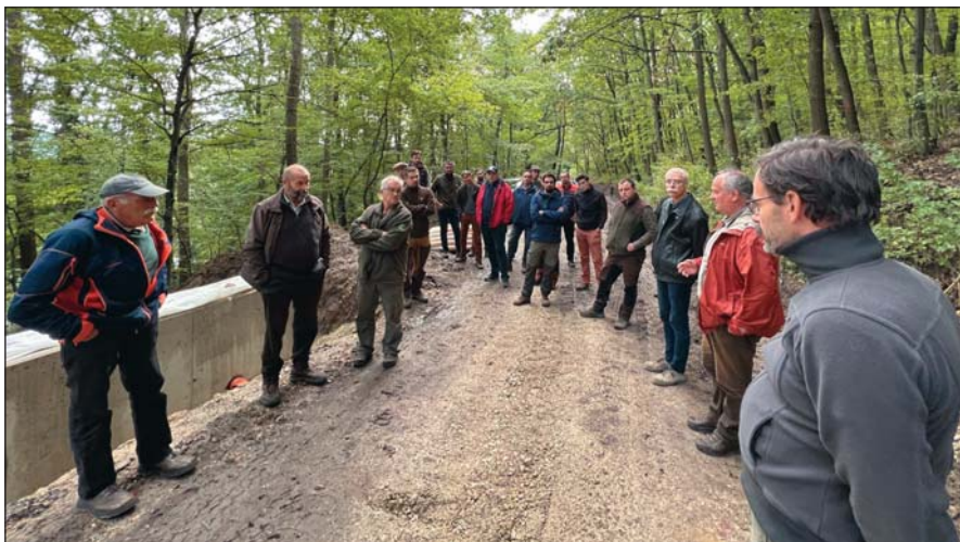
Pilisszentkereszt, Kakas-hegy – cölöp alapsorra helyezett vasbeton fejgerenda megtámasztás