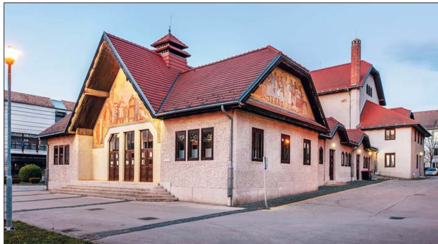
Az impozáns Medgyaszay-házban tartotta a helyi csoport a tisztújítást