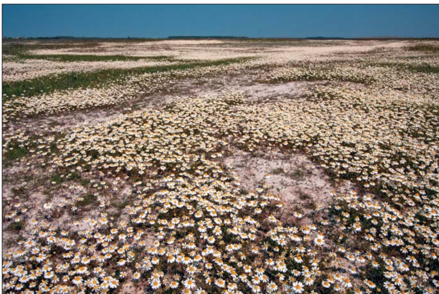
Kamillamező a Hortobágyon

A gyűjtők jól ismerték a pusztá növényvilágát. Belátták, hogy nem csak a