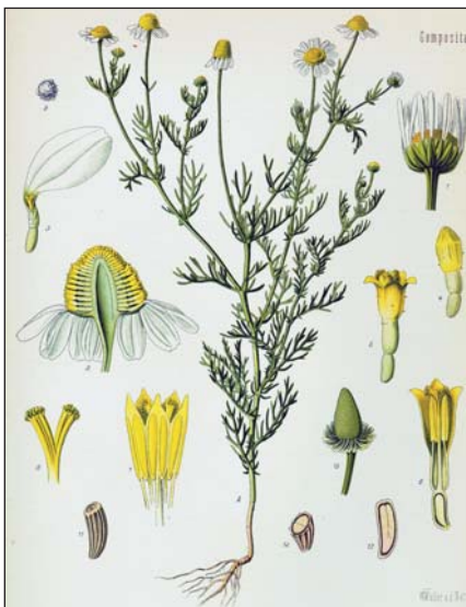
Orvosi székfű a gyógyszertárkönyvben

A padláson vékonyan elterített, lassan kiszáradó virágnak messze magasabb az illóolaj-tartalma, mint a negyvenötven fokos levegővel sokkolt és gyorszártított testvéreinek.