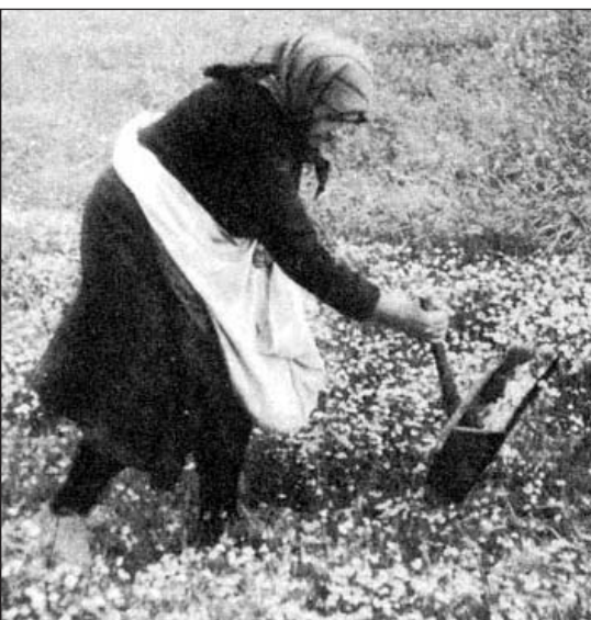
Szikfűgyűjtés a 20. század elején