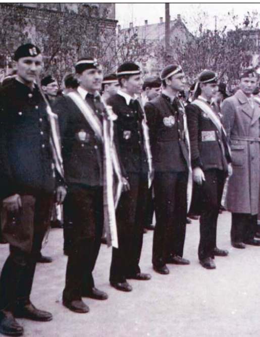
8. ábra. 1942. május 3-án felvonuló mérnökhallgatók