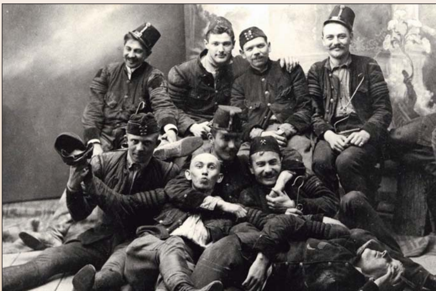
4. ábra. Selmeci akadémisták 1904-ben

Érdemes egy pillantást vetnünk a Miskolci Egyetem levéltárának egyetemtörténeti gyűjteményében fellelhető 1904-es – felszabadult, hétköznapi pillanatot megörökítő – csoportképre. A képen középen Alliquander Ödön bánya-