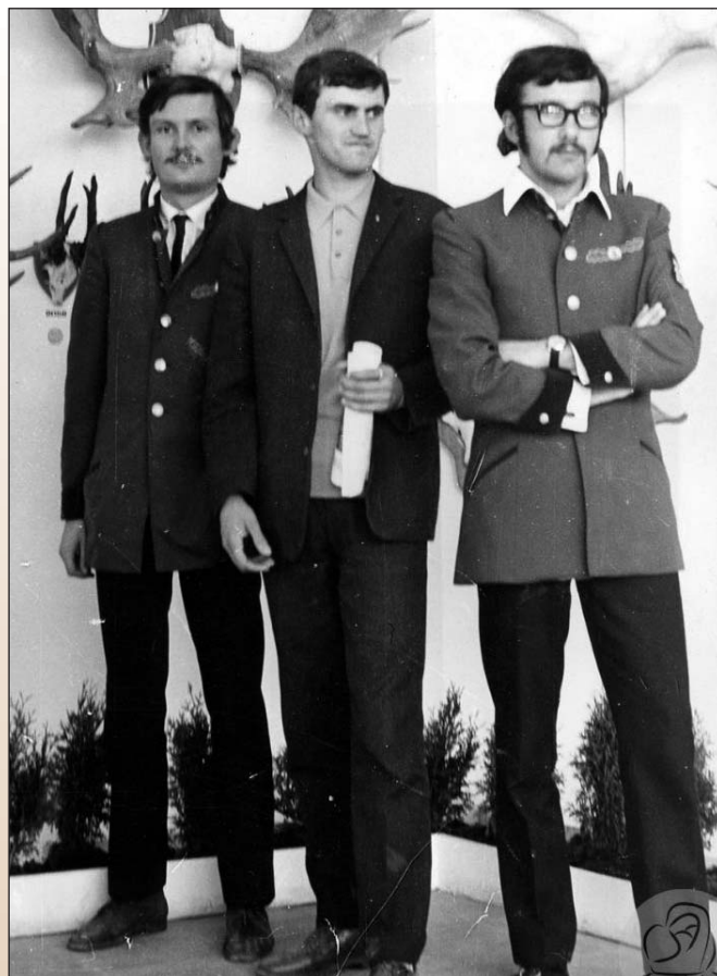
A walden 1971-es „visszatérése” a Vadászati Világkiállításon – Archív fotó: Tarjáni Antal