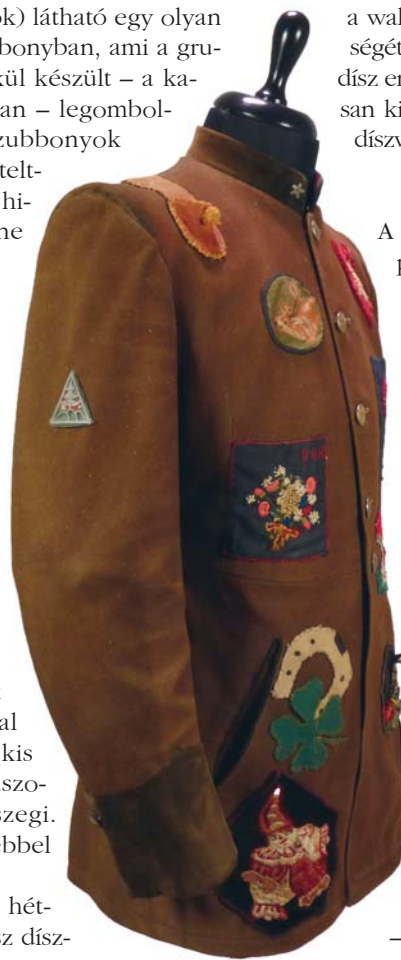
5. ábra: Walden az Erdészeti Múzeum gyűjteményéből

a walden anyagával azonos, őzbarna színben. Jelentőségét hangsúlyozza, hogy a katonai fővegek és a féldísz erdész sikkák a selmeci sapkák megjelenésével lassan kiszorultak, később Sopronban azokat már csak a díszviselethez hordták.