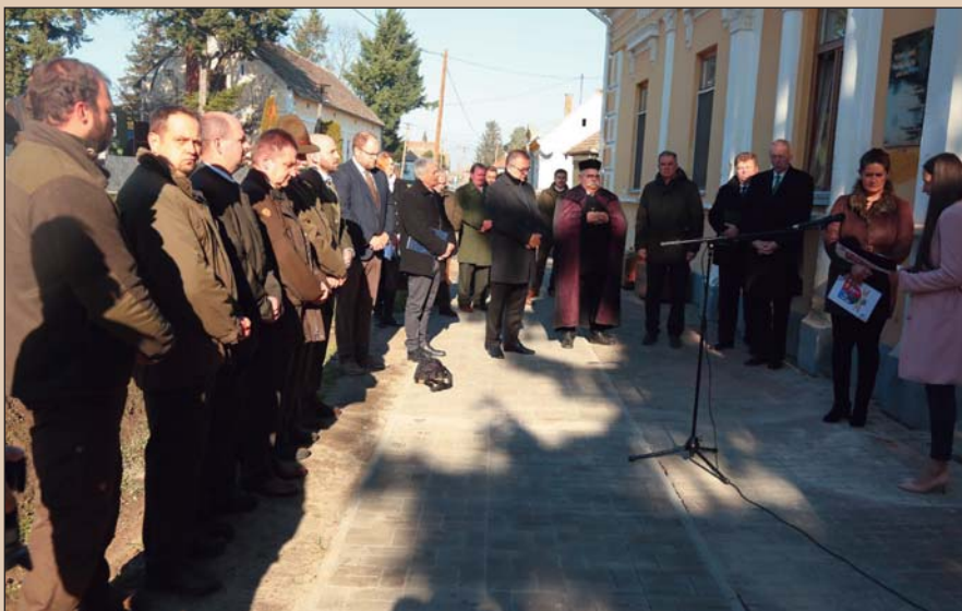
Az emléknap résztvevői Szabáson

Az összefogásra inspiráló gondolatok után Huszt Gábor arra biztatta az emlékezőket, hogy Tallián Béla példáját követve merítsenek erőt a múltból, hogy érdemesen munkálkodhassanak a jövőn, majd köszönetet mondott a település vezetőségének, hogy nem fe-