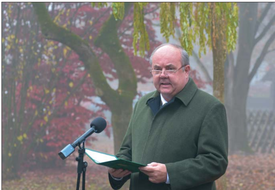
Zambó Péter államtitkár (AM) ünnepi beszédében méltatta a szakmai eredményeket

Az alföldfásítás nemzetköziesítése területén is biztosan egyetértettek volna: hiszen Tury Elemér az 1936. évi IUFRO kongresszus terepi bemutatóját szervezte meg Püspökladányban, míg Tóth Béla 60 évvel később, 1996-ban szervezte meg a Nemzetközi Nyárfabizottság XX. ülését Magyarországon, ahol a szervezet tiszteletbeli örökös elnökévé is megválasztották.