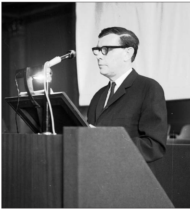
Egy tudományos rendezvény előadójaként 1973-ban (ERTT)

Kimunkálta az ökológiai szemléletű erdészeti földértékelést. Leírta a főbb fafajok éves és korszaki növekedésmenét és az ehhez kapcsolódó vízfelhasználás modelljét. Kidolgozta az erdő szervesanyag-forgalmának vizsgálati metodikáját. Meghatározta több állományalkotó fafaj szerves- és tápanyagforgalmát. Nemzetközileg is új módszert dolgozott ki a felszín alatti szervesanyag (gyökérzet) vizsgálatára. Számszerű adatokat közölt, értékes kapcsolatokat és