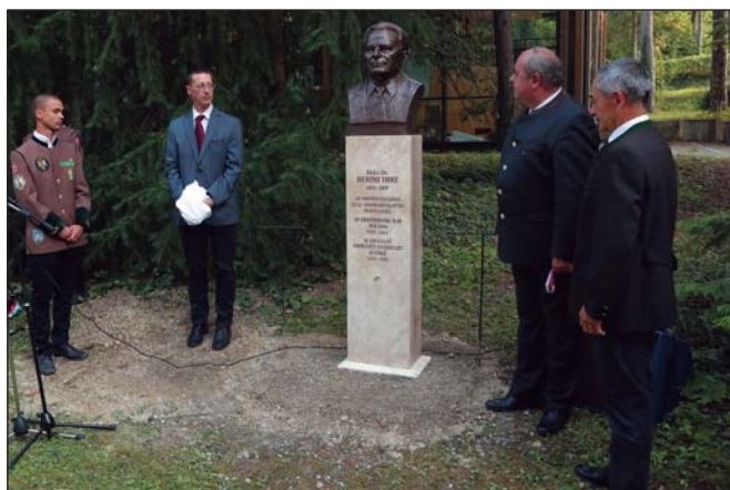
Herpay Imre szobrának avatása Sopronban

tunk együtt a szervezőkkel. Ennek is köszönhető, hogy idén Egyesületünknek ítelték oda az ún. „Zöld Tündér díjat”.