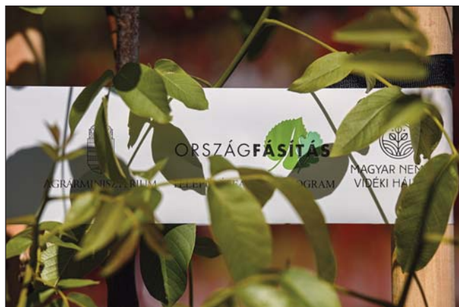
2021-ben tavasszal és ősszel is nagy lendülettel folytatódott a Településfásítási Program

jaink folyamatosan zajlottak, itt kiemelten gondolhatunk például a Településfásítási Programra, amellyel májusra már 12.000 db sorfa elültetéséig jutott el az Egyesület által koordinált agrárminisztériumi kezdeményezés. Minden egyes ültetési eseményen helyi csoport által delegált erdész kolléga segítette a szakszerűséget. E sorok írásakor, már közel 26.000 db elültetett sorfához segítettük hozzá Magyarországon 10 ezer fő alatti lélekszámú településeit.