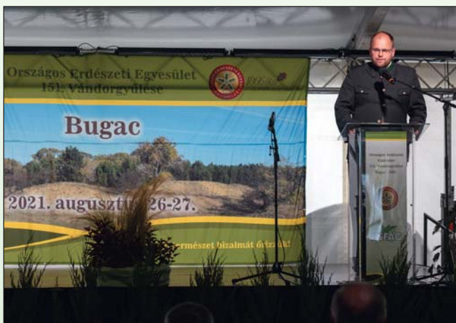
Főtítkári köszöntő a bugaci 151. OEE Vándorgyűlésen

A járványhelyzet már nem ért újdonságként minket az év tervezésekor, így az előző évtől eltérően szerencsére nem az határozta meg gondolatainkat, hogy mi az, ami nem tud megvalósulni. A megváltozott mindennapok jövőbe mutató lehetőségeit kerestük. Ennek az esztendőnek talán az Együttműködések éve címet adnám. De mik is történtek?