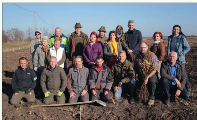
Az OMV-OEE együttműködésből megvalósult közös erdőtelepítés Békésben

Az Együttműködés éve! Több száz kisebb-nagyobb együttműködés eredménye, hogy ezek az Egyesület által kezdeményezett események megvalósulhattak. Idén újabb