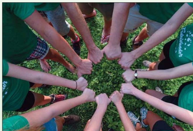
Az Erdei Vándortábor új eleme volt a Vándor Viadal vetélkedő-sorozat

A Föld Napjához kapcsolódva, a Köztársasági Elnök által kezdeményezett Fenntarthatósági Témahét központi témáját az erdők adták. Szakmai lebonyolítóként aktívan dolgoz-