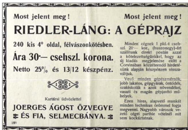
5. kép. Joerges-reklám részlete 1919. március 30-án, magyarul és csehszlovák koronával

került. Ekkor Joerges (II.) Ágost kereskedői alkalmazkodókészségéről tett tanúbizonyságot azzal, hogy elsősorban a helyi magyarokat megszólító, a Selmecebányai Vörösujság -ban megjelent reklámban az „új magyar irodalomról” tett említést, ami utalhatott nemcsak a magyar nyelvű, hanem a tanácsköztársaság által preferált „vörös” irodalomra is.