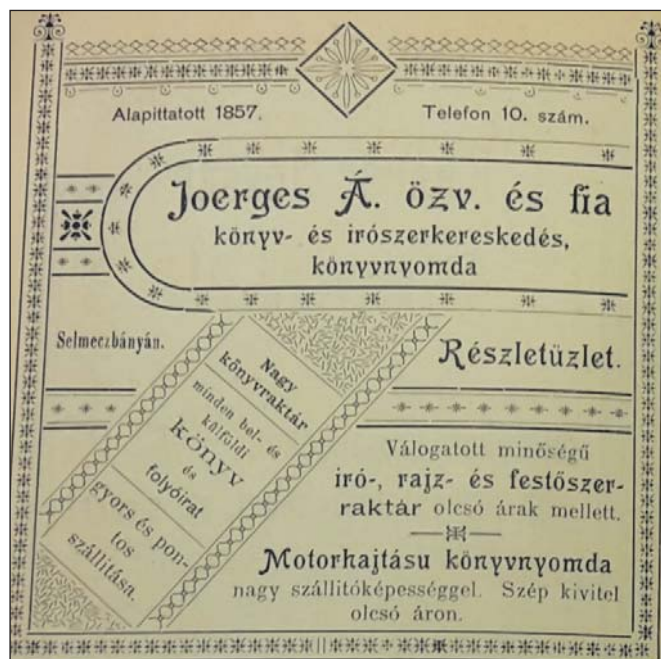
2. kép. Joerges-reklám a Selmecbányai kalauz című, turisztikai jellegű kiadványban (1898)

Joerges (II.) Ágost 1908-ban egy olvasói levél keretében kifejezte üzleti szempontjait a következők szerint: „A könyvkereskedőnek élnie kell és sok költsége van, amit mindenki, de főleg szaktárs kell, hogy belásson s tekintetbe vegyen, mert neki is igen kellemetlen volna, ha minden % nélkül kellene szállítania. Ne adjunk ki könyvet, melynél a rendes %-ot nem adhatjuk s ne vegyünk bizományba olyant. Ezt vegyük zsinórmértékül magunkkal szemben s magyarázzuk meg a könyvkereskedői bizományba adó magánkiadónak is. Már a 25% is a minimális engedmény, mely mellett éppen csak hogy létezni lehet. Megfelelő, jó csomagolást a kiadó ingyen tartozik szolgáltatni.” 14