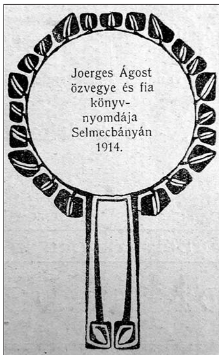
7. kép. A Főiskolai Lapok 1914. évi 5. számának hátlapján lévő Joerges-impreszum

Mindezekről – jóindulattal – azt mondhatjuk, hogy egy régi és nagy piacát veszített kereskedő az egzisztenciális túl-