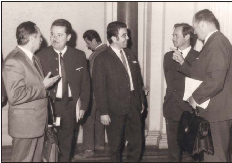
id. Koltay András az 1971-es Vadászati Világkiállításon külföldi vendégekkel (balról a 2.)

demérem ezüst fokozatával ismerik el kiemelkedő munkásságát. 1953-ban jelenik meg A nyárfa című könyve, amelyért 1954-ben a Kossuth-díj bronz fokozatával tüntetik ki. Tudományos eredményeinek köszönhetően 1956-ban Magyarországon rendezik meg a nemzetközi nyárfakongresszust. Elő-