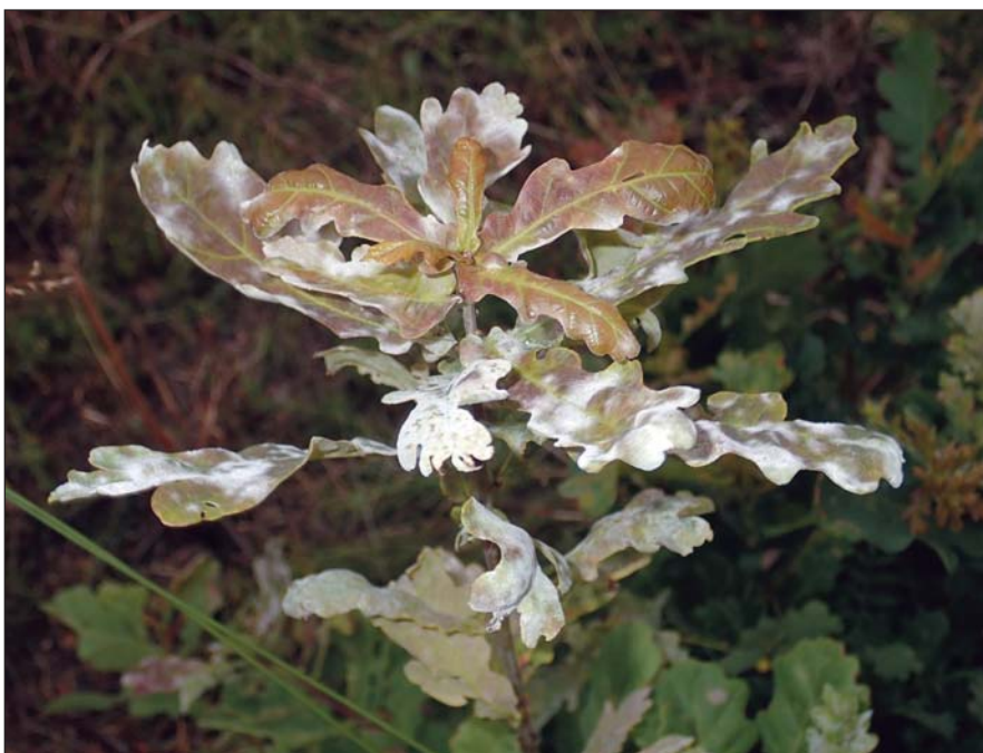
1. ábra. Lisztharmattal súlyosan fertőzött kocsányos tölgy.

Még inkább szembetűnő ez a tendencia egyes erdőrezervátumokban (pl. Horváth et al. 2018) és azokban az