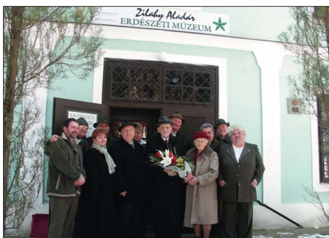
Az Erdészeti Múzeum névadó ünnepe