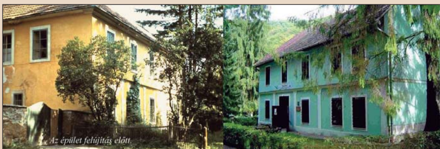
A múzeum épülete a felújítás előtt és után