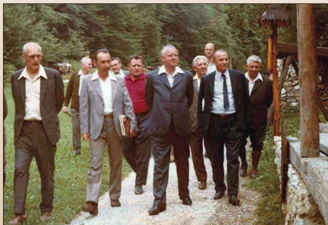
Az avatás utáni bejárás