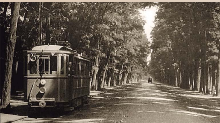
Villamos a Simonyi úton

A Nagyerdőn 1826-ban megnyílt fürdőház (Vigadó) forgalmának fellendülésével megnőtt az érdeklődés a Simonyi fasor mentén a város által kimért és méregrálgán kínált üdülőtelkek iránt. A sétányon 1863-ban már omnibusz közlekedett, amit 1884 őszén a makadám burkolatba süllyesztett síneken futó, első hazai gőzvontatású közúti vasút váltott fel. A következő évtől az akácos utat az esti órákban gázlámpák világították meg.