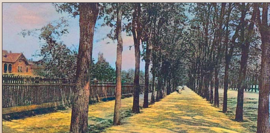
Akácos út, ha végigmegyek... (1907)

hatszáz jegenyefa csemetét ültettek el. A cívisemlékezet szerint az óbester a fák mellé, hogy azokban kár ne essék, egy-egy huszárt állított strázsának.