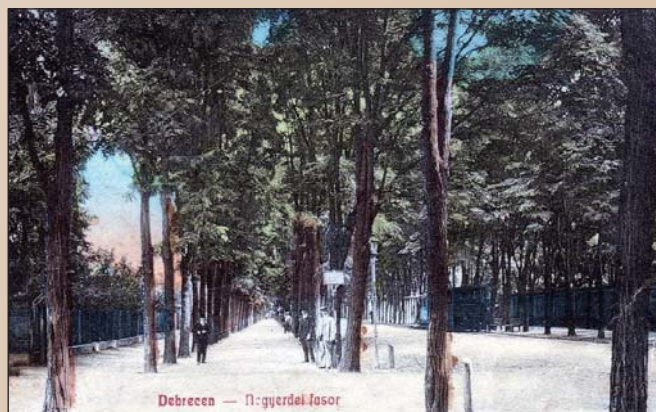
Jegenyék helyett már akác-fák sorolnak

Talpraesettségével, veleszületett tehetségével, rátermetségével, elhivatottságával, félelmet nem ismerő természetével, kivételes bátorságával hamar kitűnt huszártársai közül. Fején és testén kardvágások és szúrások behegedt nyomai tanúskodtak hősi helytállásáról, erélyességéről, rettenthetetlenségéről, hírhedt fogolyszabadításával, bajtársiasságával vívta ki „a bátrak legbátrabbja” és „a legvitézebb huszár” jelzőket. A legváratlanabb helyzetekben sikeresen zsákmá-