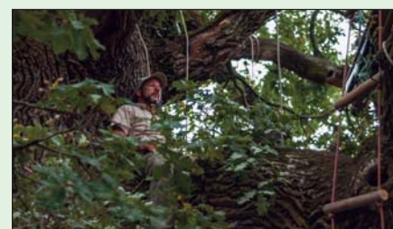
Rocksztár a fa koronájában

A Geolink 3D Kft. szakemberei lézerszkennер segítségével „tapogatják” le a fát. Rajtuk kívül a filmben feltűnik egy valóságos rocksztár is. Mégpedig Varga Livius , a méltán népszerű Quimby együttes tagja. Aki nem mellékesen elhivatott környezet- és természetvédő, valamint pszichológus, szövegíró, ütőhangszeres, rapper, énekes, frontember, showman és profi természetfilmes. Livius a forgatás során több napra felköltözött a tölgy koronájába, hogy ott készítsen felvételeket a fa lakóiról.