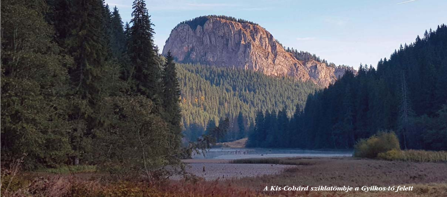
A Kis-Cobárd sziklatömbje a Gyilkos-tó felett