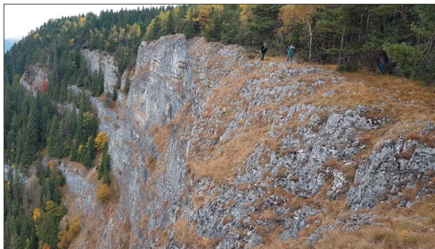
A Tündérbert tetején