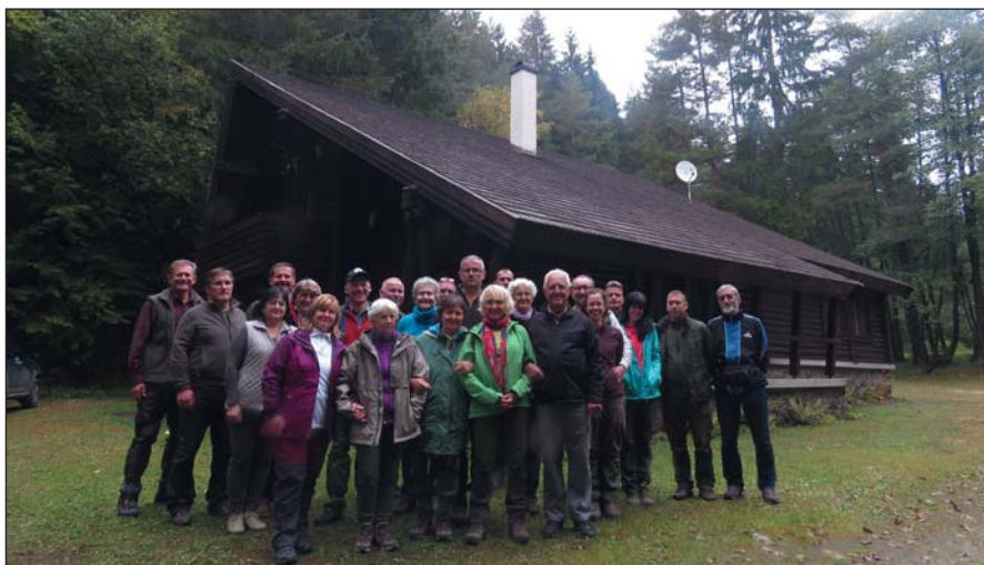
Csoportkép a vadászház előtt

Neamt megyében és a Bucsecs-hegységben is vannak tanösvények, illetve a korábbi napokban részünkről is megismert Gyilkos-tó körüli védett területekre összpontosul a fő közjóléti tevékenység.