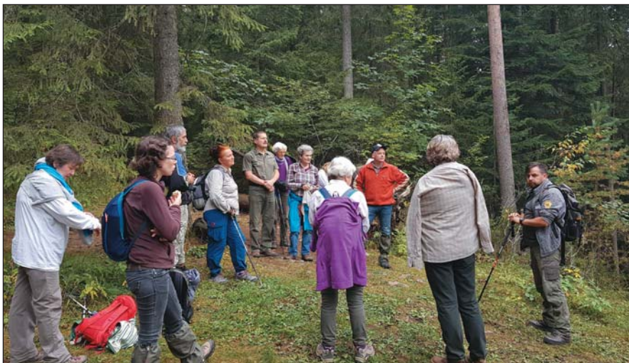
Kísérőnk mesél a környékről

Az 1315 méter magas Gyilkos-csúcsról aztán csodás kilátás nyílt a környező hegyekre, jól látható innen a Nagy-Hagymás vonulata. A Gyilkos-tavat is megcsodálhattuk madártávlatból, és vezetőnk elmesélte a tó keletkezésének történetét, amelyben valószínűleg az 1837-ben a környéket sújtó vihar, és a lehullott nagy mennyiségű csapadék játszott döntő szerepet. A tó később folyamatosan töltődött az őt tápláló 4 patak, a Likas-, a Veres-, a Cohárd- és Juh-patakok által. 1970-ben több hordalékfogót is építettek, azonban azok mára nem működnek, és a Juh-patak völgyében a '90-es években végzett nagyarányú fakitermelés is jelentősen