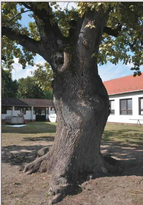
Móra Ferenc Emlékfa