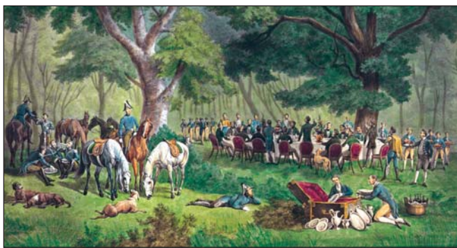
Ozorai vadászatok, herceg Esterházy uradalom

gü vendégek felé, a gyulai erdőtümbbe, ahol az egész területet végjavadászták.