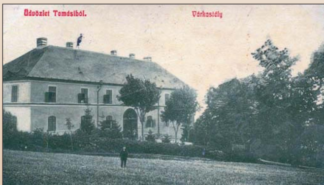
Miklósvár. Esterházy uradalma Tamásiban

A Tengelici környékén elterülő homokos pusztákat I. Lipót császártól kapta a Gindly család, akik győri tőzsérek voltak, és hadi szállításaik fejében pénz helyett birtokokhoz jutottak. Kastélyaik fénykorukban méltán érdemelték ki a „magyar Loire-völgye” jelzést! Az egykor pompás kastélyok a „jó gazda gondosága” hiányában lepusztultak.