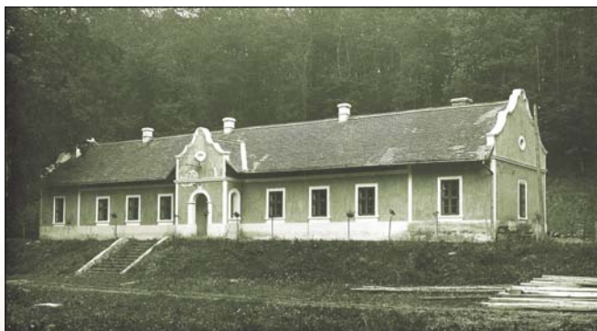
Apponyi uradalom, Annafürdő. Képeslap 1930-ból

A második világháború befejezése után Tolna megye német ajkú lakossága egy újabb megpróbáltatásnak volt kitéve. A kollektív bűnösség jegyében teljes német ajkú vagy csak német nevű családokat telepítettek ki. A kitelepítések nyomán a megye nagyon sok, egykori sváb települése szinte kiürült. Az üresen álló házakba, illetve a kitelepítésre kényszerített, de még nem elszállított lakókhöz betelepítettek menekülteket, akik a saját szűkebb hazájukat elhagyni kényszerültek a harcok miatt. Ide lettek irányítva a Felvidékről, részben a Csallóközből elüldözött magyar családok, akik a lakosságcserével 1947–1949 között érkeztek. Szintén ide terelték a bukovinai székely falvak (Istensegíts, Fogadjisten,