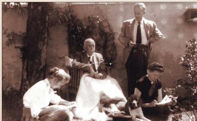
A Térfi család