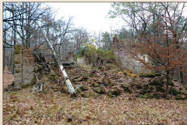
1996-ban, 2004-ben és 2014-ben