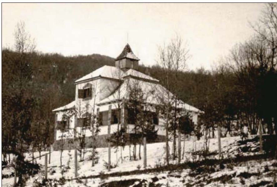
A kastély 1934-ben

használták. Lakás céljára nem volt alkalmas villany és épített út hiányában.