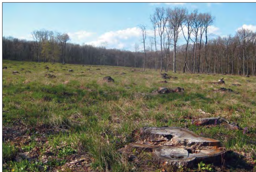
Vágásterület védett erdőben (Budai-hegység)

ahhoz további, természetességhez kötődő, vagy egyéb feltételnek kell teljesülnie. Mindez a szóban forgó erdőterület jelentős részén csökkent a tényleges védettség elért szintjét, gátolja az erdei élőhelyek fejlesztését, miközben jogi eszközökkel különbséget tesz hasonló természetvédelmi státuszú területek között.