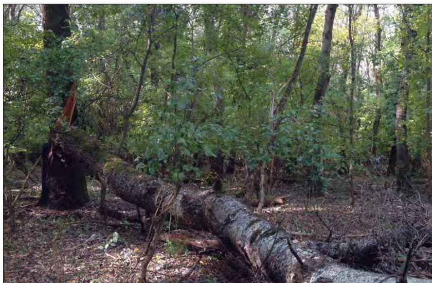
Holtfa, ártéri erdőben (Maros-ártér, Arad mellett)