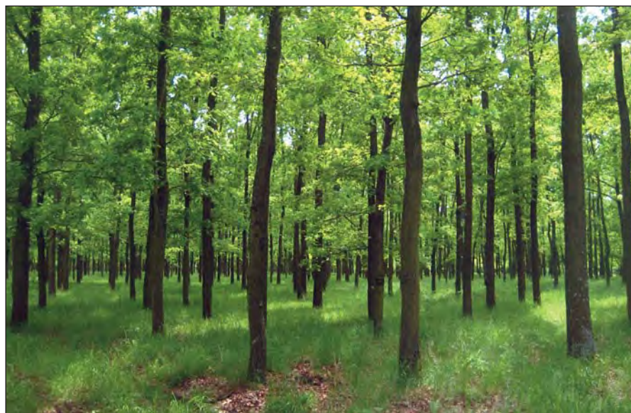
Telepített tölgyes (Velencei-hegység)

Fontos változás, hogy a módosított erdőtörvény a természetvédelmi korlátozásokat az elsődleges rendeltetéshez, a természetességhez, illetve esetenként további feltételekhez köti. Védett er-