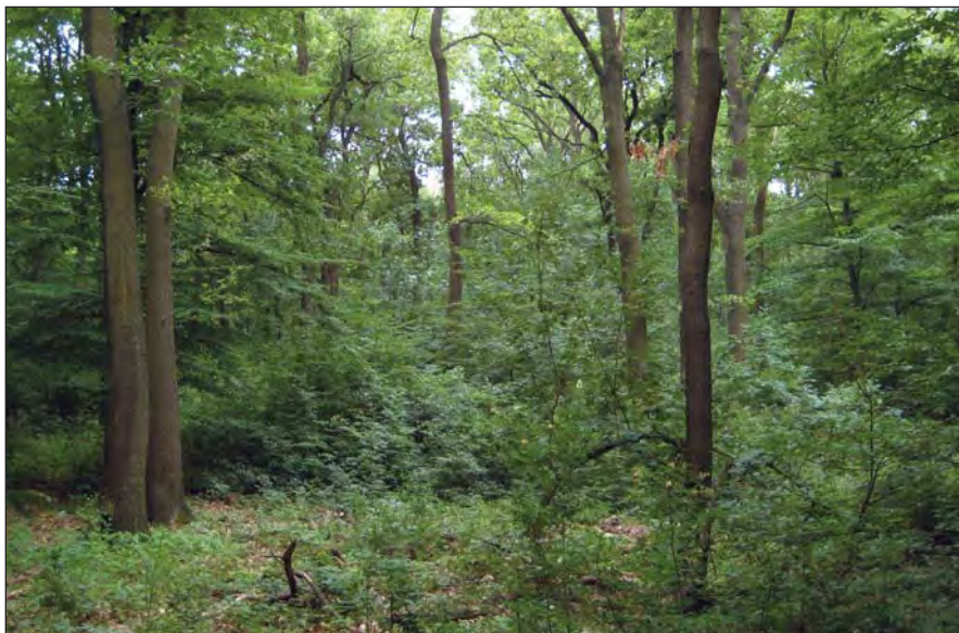
Tölgyes száraló erdő (Balaton-felvidék)

Az erdőtörvény 2017. évi átfogó módosítása jelentősen érintette a természetvédelmi célú paragrafusokat. Az erdőtermészetességre, rendeltetésre,