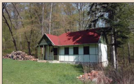
A régi és az újjáépített Guba-ház