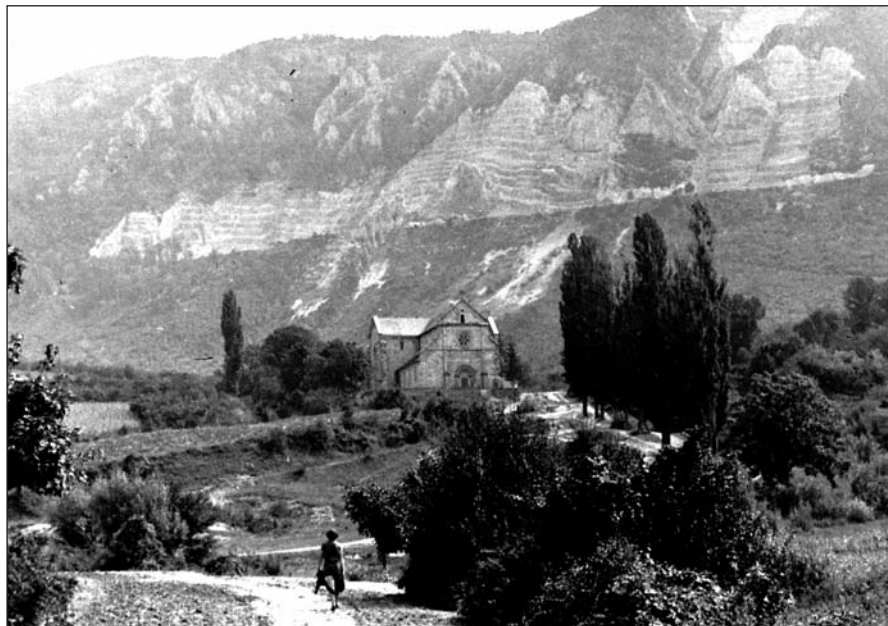
Az apátsági templom (1945)

Bélapátfalva település – mára már város – több mint ezeréves történetében fontos dátum 1232, amikor II. Kilit püspök megalapítja a Béli apátságot a ciszterci szerzetesek részére, ekkor építik a nevezetes apátsági templomot a hozzá kapcsolódó kolostorral. Eredetileg Bélháromkúti apátság néven szerepelt. Kilit püspök nevét fedezhetjük fel a Mónosbél határában álló Gilitka (Szent Anna-) kápolna elnevezésében is.