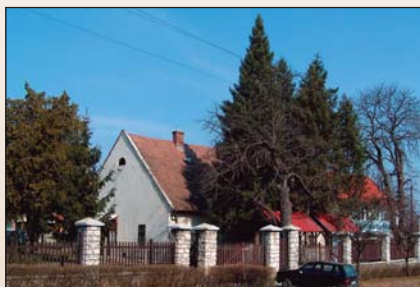
A gondnokság épülete régen és ma

A foton a bélapátfalvi központ épületét látjuk az 1950-es és a mai formájában, itt voltak a hivatali helyiségek, és itt lakott a gondnok. Az évtizedek során valóságos kis gazdaságot alakítottak ki a telepen, volt itt lóistálló legálább négy pár lóval, asztalosműhely, baromfiudvar, nagy kert gyümölcsös-sel, tehének, sertések, fürdőmedence gyerekeknek. Akkor autó még nem