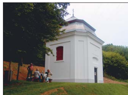
A Gilitka kápolna avatása és a kápolna