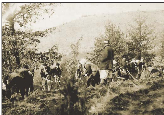
Hársasi kert és az Ültetőbrigád

Vince-rét, Hársas és Meszes-híd. A Hársasi kert állomány alatt volt, főleg bükk részére, a Meszes-hídi pedig az útmenti fásításokhoz termelt.