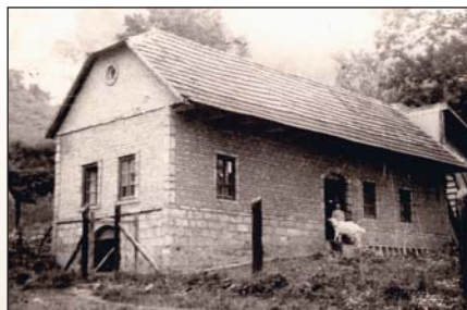
Erdészeti épület a Nagytemplom mellett

Említést érdemel az apátsági templom (a mi időnkben egyszerűen „Nagytemplomnak” hívták) mellett álló épület. Közel egy évszázadon át itt állott a keménycserépgyár (más néven kőedénygyár), melynek termékei, a gyönyörű festett edények messze földön hírnevet szereztek a településnek. Ezt a gyárat 1928-ban lebontották, helyén a tulajdonos Papnevelő felépítette a képen látható épületet erdészete számára.