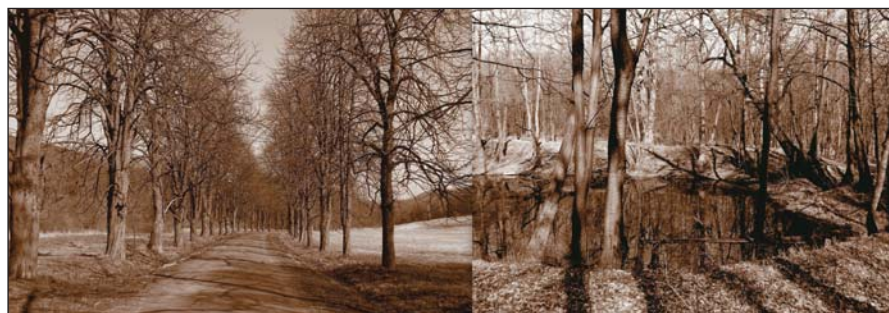
Ilona-völgyi fasor és Sándor-réti tómaradvány (2005)

faiskola megalapítójaként ” tartsa emlékezetében.