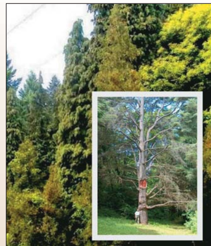
Az arborétum az atlaszcédrussal

A fényképen a faóriás mellett álló személy Vámos Károly erdész, az ar-