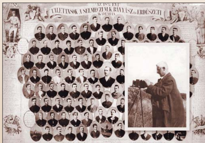
Selmecei valetánsok 1889–90-ben

Az erdészethez és Selmecehez mindvégig hű maradt, néhány év múlva már mint az Akadémia tanára tért vissza az alma materbe, a növénytan oktatója lett. Tanári pályafutása később Budapesten folytatódott, a Műegyetemen a növénytant tanította nagy szakmai szeretettel, fő témaköre a növényrendszertan és a növényföldrajz volt.