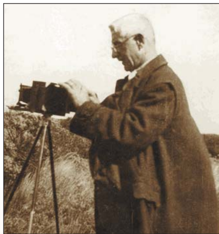
A tudós professzor

A tuzsoni életmű tudományos-kutatói oldala rendkívül széles körű, itt csak a legfontosabbakról teszünk említést. Behatóan foglalkozott a fás növények szövettanával, az élő fák gombakárosítóival, gyógynövénytermesztéssel, az Alföld flórájának történetével és még sok mindennel, ami a botanika tudományához tartozik.