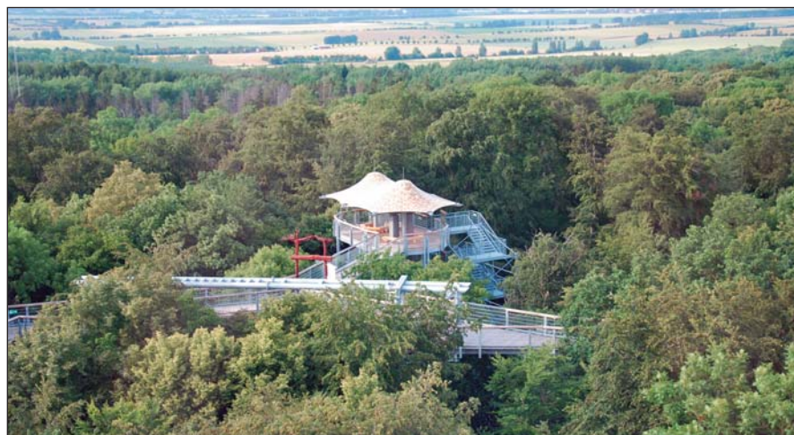
Lombkorona-tanösvény, Hainich

Jelentősen segítette a tanulmányutak szervezését a Tübingi Erdészeti Egyesület (Thüringer Forstverein) és az OEE Budapesti HM-csoportja között kötött