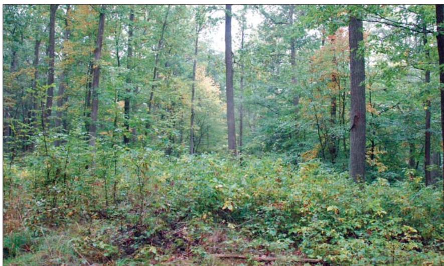
Kis lék szép újulattal, Heldburg