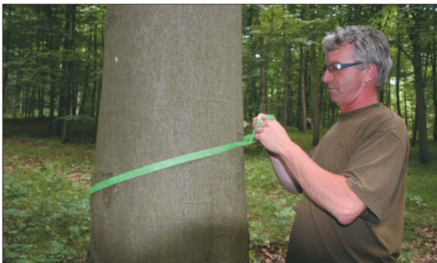
Jelölési gyakorlat, Hainich

A programok tehát minden utazás során az örökerdő-gazdálkodás jegyében zajlottak. Itt tudtuk meg, hogy mi a különbség az örökerdő-gazdálkodás, a szálalás, a célátmérős fakitermelés és az állandó borítottságot biztosító erdőkezelés között. Nem egyszer került sor arra, hogy a német kollégák „jelölési gyakorlatot” szerveztek számunkra azokon a helyeken (Ebrach, Hainich, Erfurt), ahol a – szálalóállományokban – a német erdészhallgatók is tanulják, gyakorolják a jelölést.