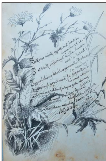
Archív Valéta-könyv (dr. Sipos András adománya)