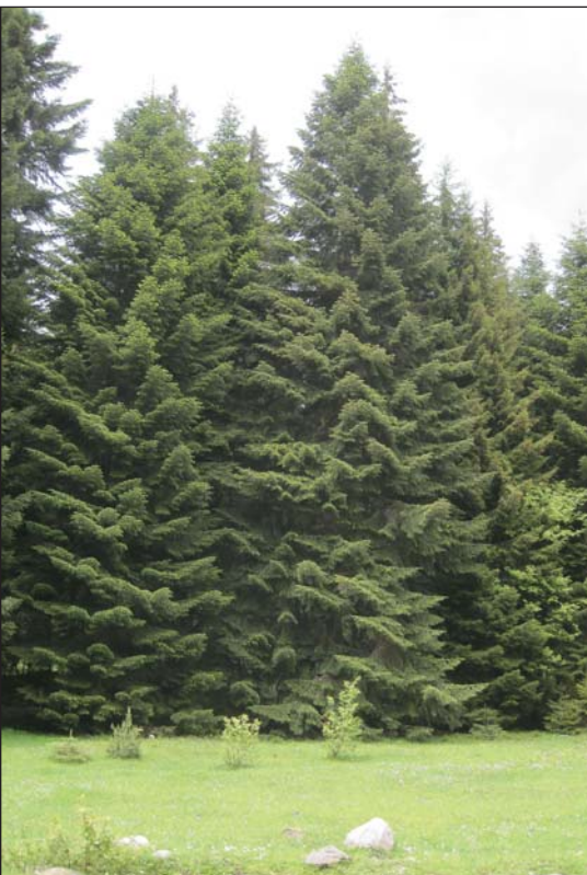
Ambrolaurihoz közeli erdő szegélye

Szöveg és kép: Gerely Ferenc, Hegedűs Attila, Szentesi Zoltán