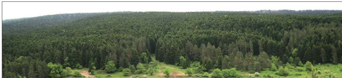
A Tlugi erdő rengetege

rek. Grúzia a Kaukázus két lánc között fekszik, virágzó termékeny vidék. Az ott élők kemény és harcias nép, ugyanakkor vendégszerető és életvidám.