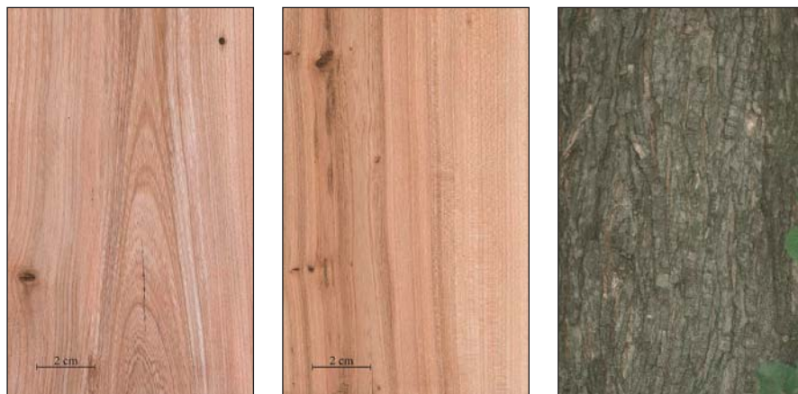
2. ábra A mezei szil fájának bőr- (bal) és sugármetszete (közép), valamint kérge (jobb)

zöldött edényei, az elkülönülő pászta, a kisméretű, de színbeli eltérésük miatt jól látható bélsugarak, a kellemes közép-barna színárnyalat rusztikus hatású, sajátos szépségű rajzolatot, megjelenést adnak a mezei szilnek.