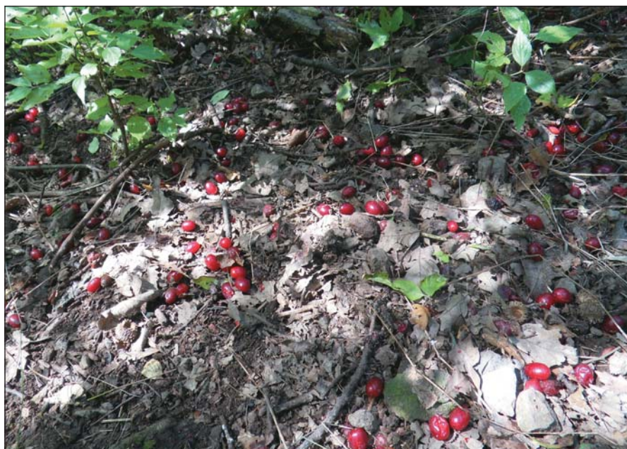
1. kép. Természetes szóró bírsos som bokra alatt

A gyümölcs elfogyasztása mind a vaddisznó, mind a növény számára előny. Az adott növényfaj gyümölcsét több állatfaj is fogyaszthatja, ami a növény szempontjából fontos, hogy biztos legyen magjai célba juttatása. Az anyanövény alól való eltávolodás ugyanis csökkenti a versengést, lehetővé teszi a megtelepedést új területeken, és a génáramlás révén elősegíti a genetikai diverzitás fenntartását. A magterjesztés növény és állat közötti kapcsolatrendszerre biztosíthatja tehát erdei gyü-