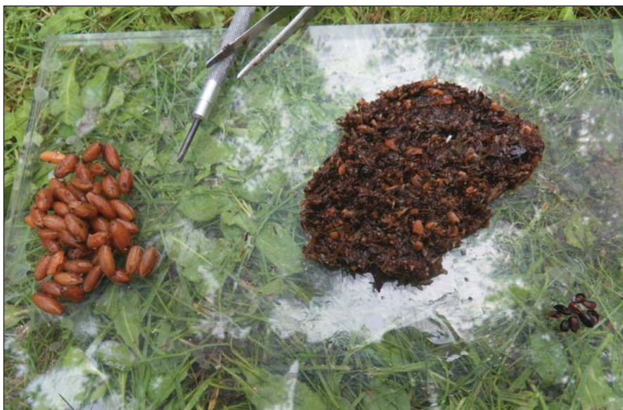
2. kép. Egyetlen vaddisznó-hullatékban is ilyen sok búsossom-mag lehet

mölcstermő fajaink stabilabb fennmaradását is (Mráz–Katona, 2016a).