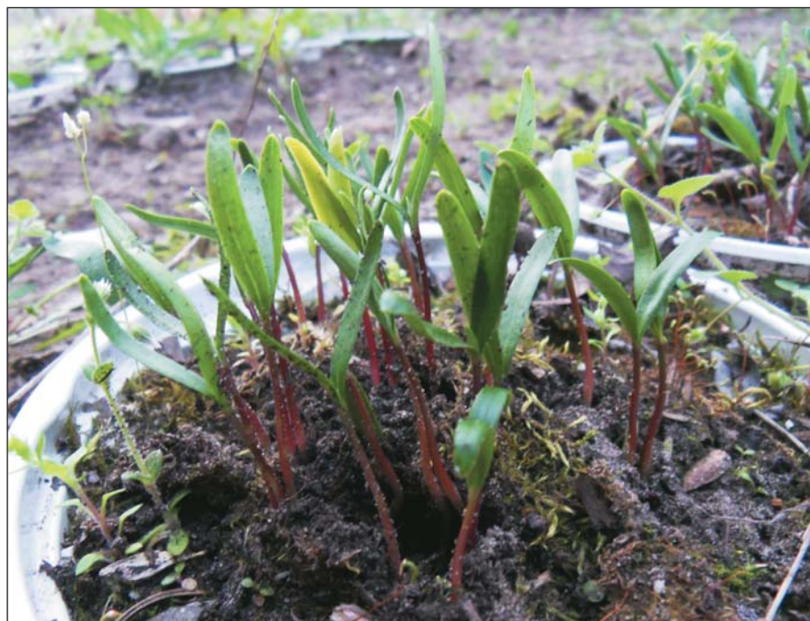
3. kép. Vaddisznó-hullatékban talált húsossom-magokból fejlődő csíranövények

szőnyben gyűjtöttünk vaddisznó-hullatékot a gyümölcserés időszakában, augusztus-szeptemberben. Ezek szétmossáskor megtaláltuk a faeper, húsos som, vadkörte, vadszed, vadalma és gyertyán épen maradt magjait. Egy hulladék átlagosan 132 magot tartalmazott. Eddig 12 vaddisznó-hullatékot vetettünk alá csíráztatási kísérletnek, melyekből összesen 125 csíra kelt ki (som, vadszed, vadkörte).