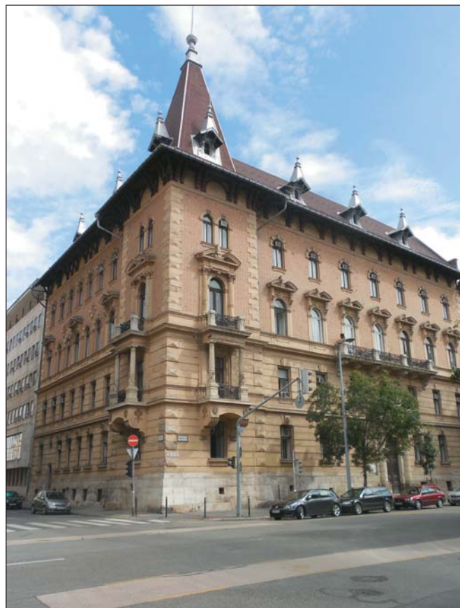
Az OEE székháza egykor és ma