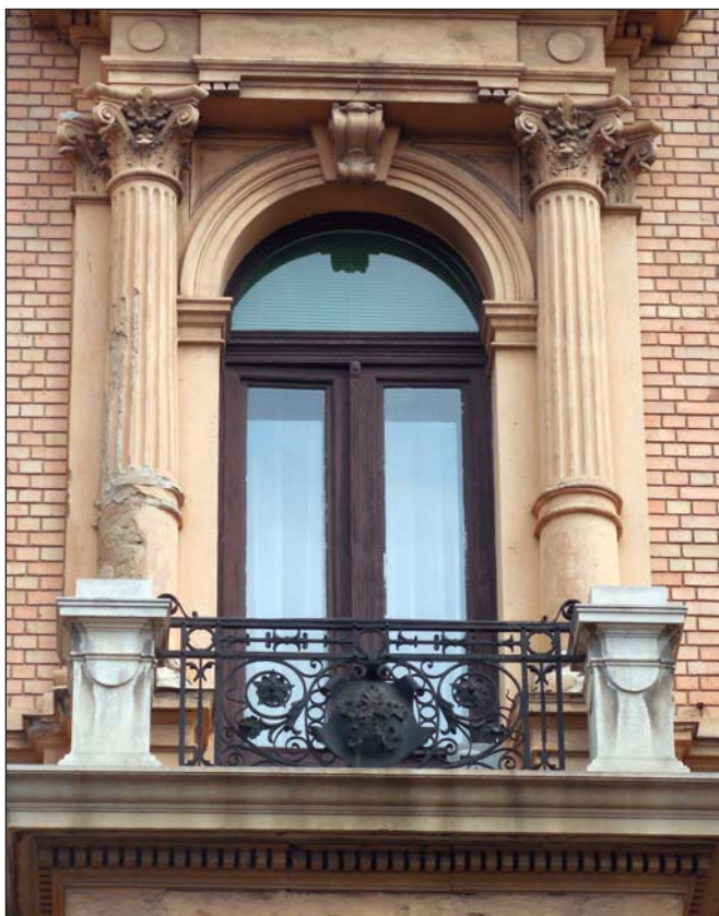
A kovácsoltvas díszben az erdészcsillagot stilizált vadbőrre helyezték el

BIZ által megadott épületekbe az előírt határidőre. Így először a TERVHIVATAL, majd a Külkereskedelmi Minisztérium részére kellett fokozatosan átadni előbb részlegesen, majd teljes egészében, bérleti díj fizetésére szóló szerződési kötelezettséggel (amit aztán egyik szerv sem fizetett meg az OEE-nek). Ezek a KÖZELBIZ-es döntések egyébként fél A4-es, rossz minőségű előstencilezett formanyomtatványra íródtak, igen gyenge minőségű papírra, sőt az államosítás iratai is hasonló „igényességről” tanúskodnak.